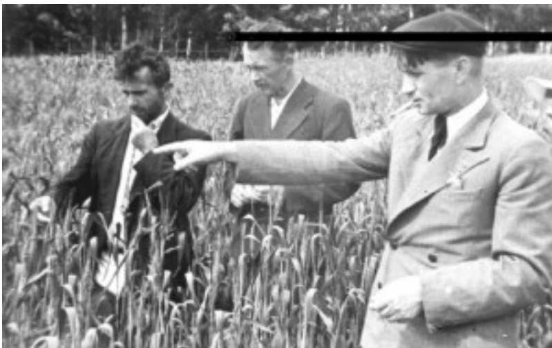
Т.Д. Лысенко (справа) на поле