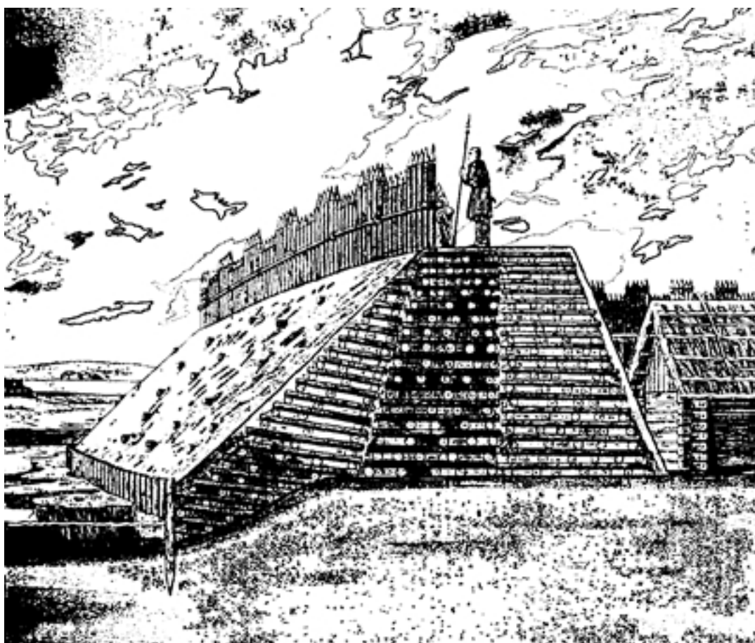
Рис.3. Реконструкция решетчатых конструкций в основаниях валов городищ