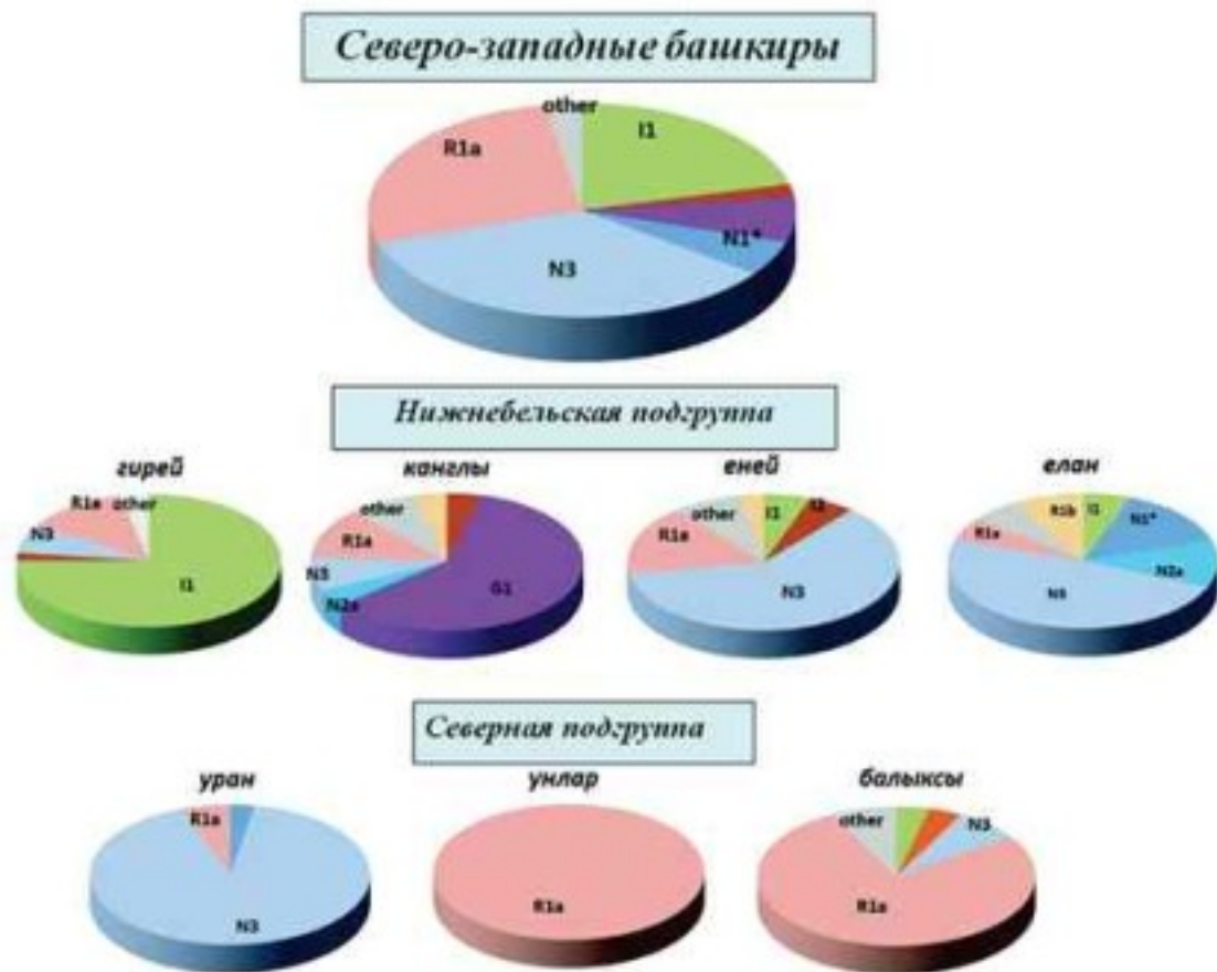
Y-хромосомные генетические портреты кланов северо-западных башкир.

Как оказалось, из семи генетических портретов кланов северо-западных башкир лишь два (унлар и балыксы) хорошо согласуются с гипотезами их происхождения, построенными по данным этнографии. Не противоречит этнографической версии происхождения и генетический портрет клана еней, хотя основной генетический вектор направлен не на запад, в Европу, как указывает историография, а на северо-восток Сибири. Генетический вектор для клана канглы также не противоречит этнографической гипотезе их происхождения, если предположить, что он опосредован миграциями сармато-аланских племен в Урало-Поволжье. Для остальных трех кланов (гирей, уран и елан) этнографическая и генетическая версии не согласуются. Этнографические версии предполагают их кыпчакское происхождение, а генетические портреты отражают связи с финно-угорским миром Восточной Европы.