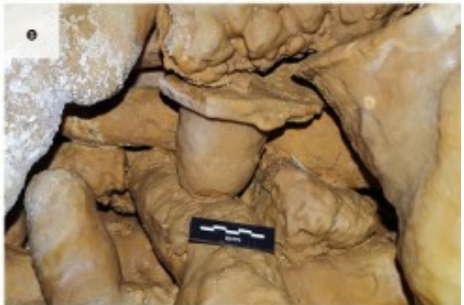
Сталагмиты, уложенные горизонтально (b), в виде косых подпорок (c), использующиеся для опоры (d, e)

Все шесть сталагмитовых конструкций, а также пол пещеры несут следы воздействия огня в виде покраснения или почернения известняка. Соседство с огнем — важный аргумент в пользу антропогенного происхождения конструкций.