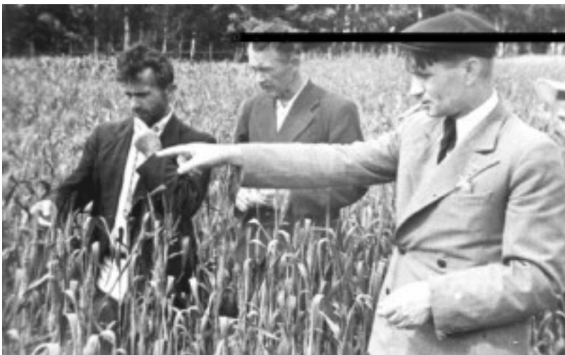
Т.Д. Лысенко (справа) на поле