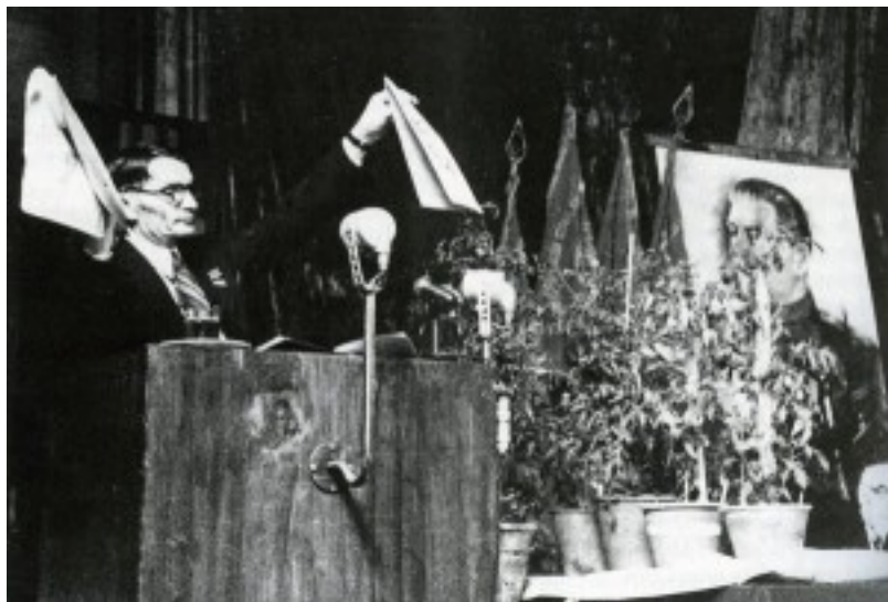
Сессия ВАСХНИЛ 1948 г.

его противники, сосредоточившись на зародышевой плазме, генах и т.п., условия среды игнорировали. Все это, мягко говоря, не имело ничего общего с реальностью. Ни один здравомыслящий биолог никогда и нигде не игнорировал и не мог игнорировать условия среды, в которой растет и развивается живой организм. Спор шел о том, можно ли этими условиями переделать в нужном направлении наследственную природу или нет. Доказательств в пользу такой возможности не было, Лысенко ни одного нового доказательства не дал, но требовал, чтобы в его доктрину все верили без доказательств. Несогласных третировал как врагов народа, социализма, советской власти. В этом суть биологических «дискуссий» того времени.