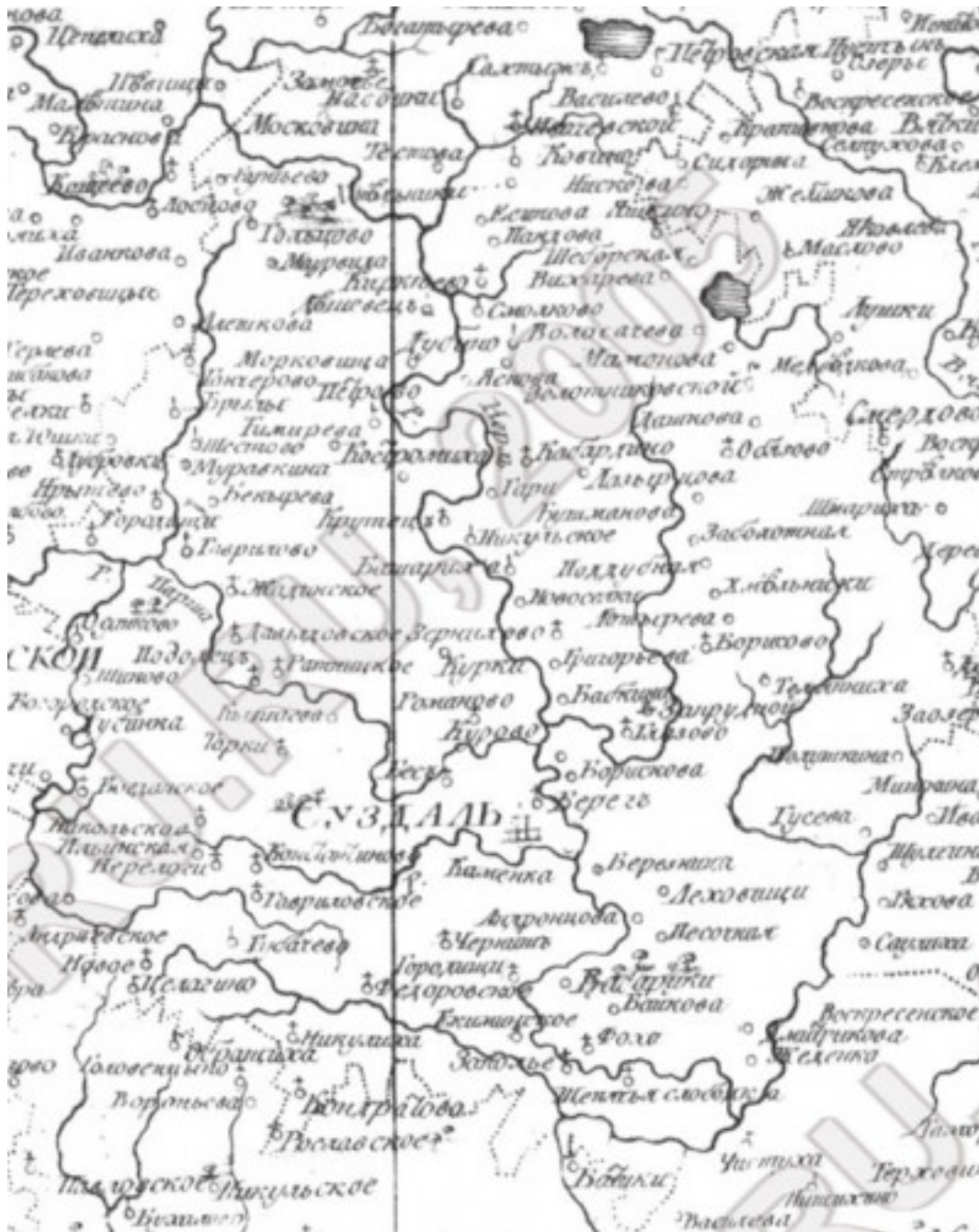
Карта Владимирско-Суздальской губернии, 1792 г.

Таким образом, мы видим, что в бассейне Клязьмы наблюдается целое гнездо гидронимов, образованных по редкой и архаичной топонимической модели с префиксом Су- — и суффиксом -ль , и, шире — -ь . Топоним Суздаль , соответственно, является не единичным феноменом в этом микрорегионе — и должен объясняться именно как часть этого топонимического гнезда.