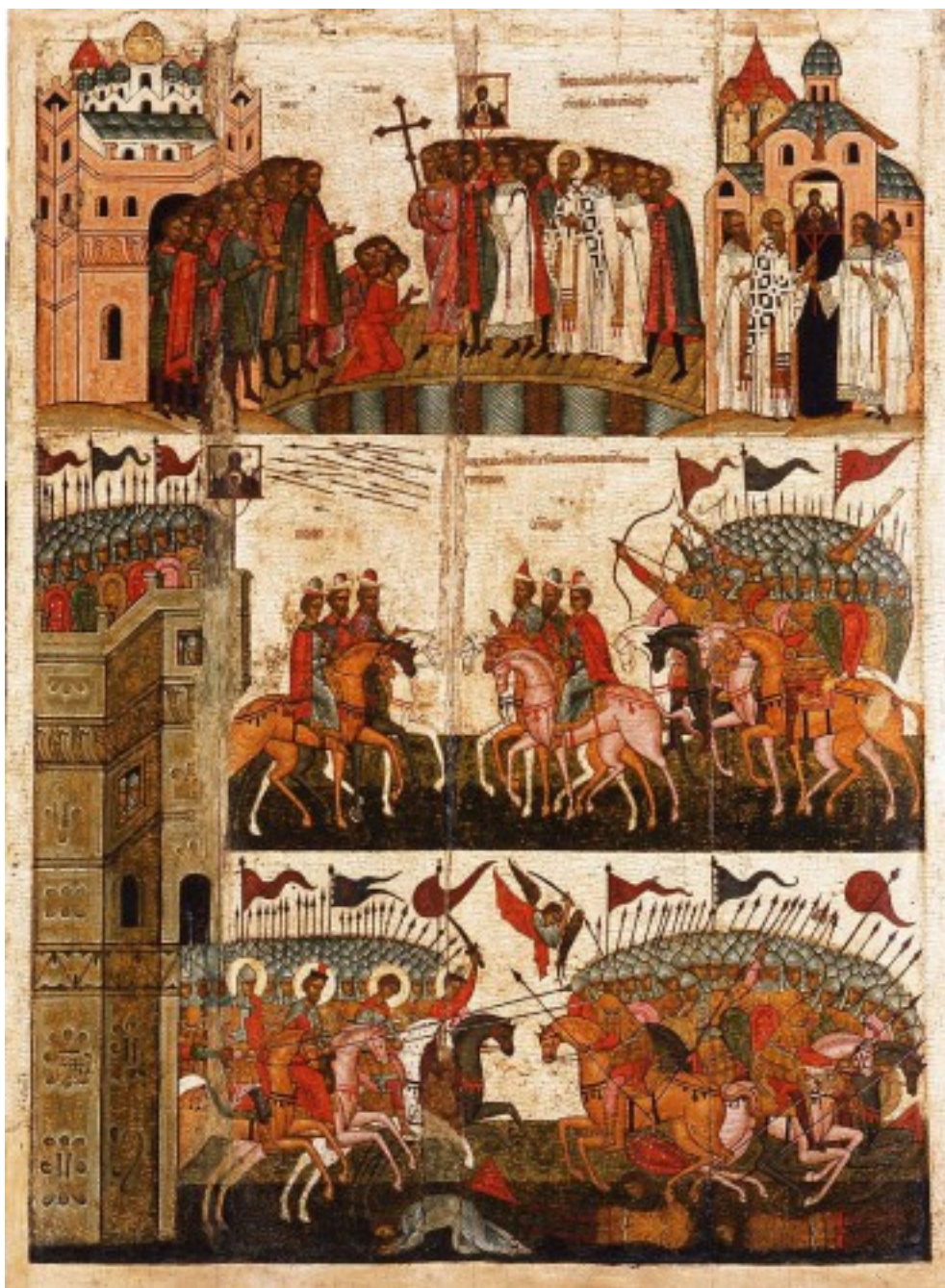
Битва новгородцев с суздальцами. Икона XV в., Новгородский музей.

Однако, как следует и из археологических, и из исторических данных, Суздаль возникает еще в X веке. Как указывает Н. А. Макаров: «М. В. Седова относил возникновение Суздаля к первой половине X в. Согласно её наблюдениям, древнейшее славяно-мерянское поселение представляло собой мысовое городище с тремя линиями рвов и валом в северо-западной части кремля площадью около 1,5 га. Эти укрепления были срыты не позднее первой четверти XI в., очевидно, после восстания волхвов 1024 г., когда Ярослав соорудил более мощные укрепления, охватывавшие площадь 14 га» (Макаров 2012: 204).