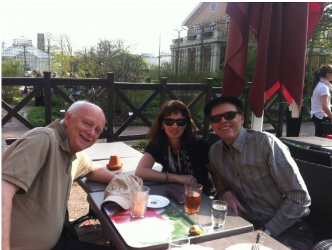
К. Кристиансен с коллегами – Яном Ходдером и Линн Мескель в прошлом году в Гётенбурге, Швеция. Ян Ходдер — один из самых знаменитых археологов мира, лидер пост-процессуализма (пост-модернизма в археологии).

Таким образом, интерес у меня возник с начала 1980-х.