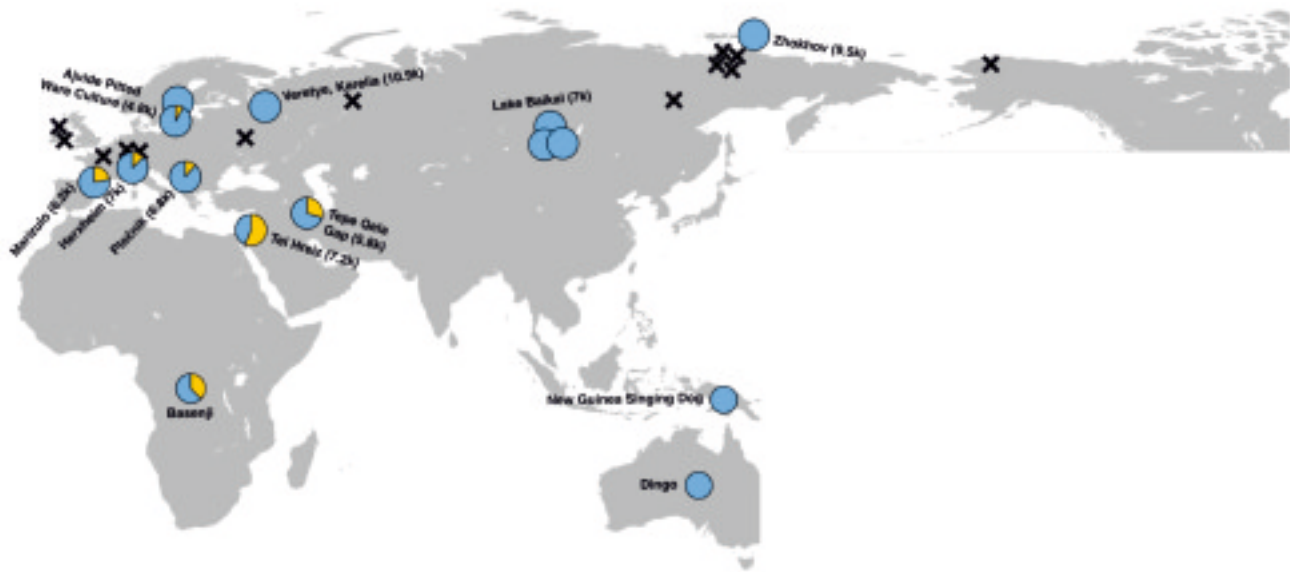
Рис. 3. Распространение древних и более молодых собак и их предковые популяции волков: синий цвет – восточные популяции (на основе ДНК собак с о. Жохова); оранжевый цвет – западные популяции (на основе современного волка из Сирии); крестики – популяции волков с возрастом 25–10 тыс. л.н., не являющиеся предками собак.

собаками о. Новая Гвинея (рис. 3). Таким образом, можно заключить, что все они происходят от одной популяции древних волков – вероятнее всего, из Сибири.