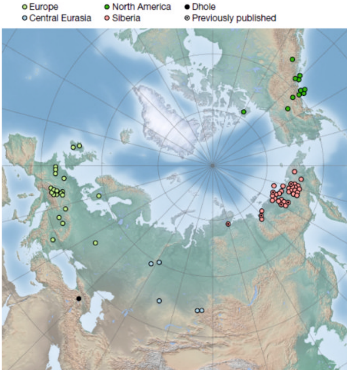
Рис. 1. Карта местонахождений древних волков с новыми данными по ДНК (источник: Bergström et al., 2022).

Во-первых , популяции волков, жившие после 23 тыс. л.н., по ДНК генетически гораздо ближе друг к другу, чем жившие ранее 28 тыс. л.н. Более молодые волки ближе к сибирской группе древних волков, чем к европейской или среднеазиатской. Это означает, что ДНК волков сибирского типа распространилась на территории Европы около 35–50 тыс. л.н. Таким образом, Сибирь выступала в качестве источника, а Европа – «приёмника» мигрирующих по Евразии волков; свидетельств движения в противоположном направлении не найдено. Последствия расселения сибирских волков в древности обнаружены в ДНК волков Северной Америки – на Аляске и в бассейне р. Юкон. Таким образом, до 23 тыс. л.н. степень дифференциации ДНК волков Евразии и Аляски была низкой; источником их расселения была Сибирь. В голоцене (последние 10 тыс. лет) и даже несколько ранее, около 20 тыс. л.н., миграции из Сибири прекратились, и европейские популяции волков распространились на Сибирь и Китай.