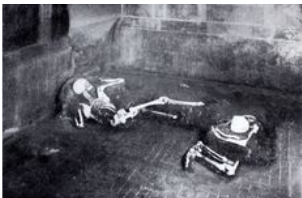
Останки мужчины женщины из Casa del Fabbro в Помпеях.

Проанализировать ядерную ДНК удалось итальянским генетикам в сотрудничестве с коллегами из США и Дании при исследовании скелетных останков мужчины и женщины, которые были найдены при раскопках Помпей в 1910 году. Их нашли лежащими возле небольшого возвышения в так называемом «Доме художников» ( Casa del Fabbro ). По особенностям костей специалисты установили, что мужчине в момент смерти было от 35 до 40 лет, а женщине – более 50 лет. ДНК извлекли из каменной кости черепа обоих индивидов. Молекулярное определение пола подтвердило результаты, сделанные по морфологии. Покрытие генома, которого достигли при секвенировании, составило 0,4X для мужчины и 0,0013X для женщины, так что проанализировать геном удалось только для мужчины (индивида А), ДНК женщины оказалась слишком фрагментирована.