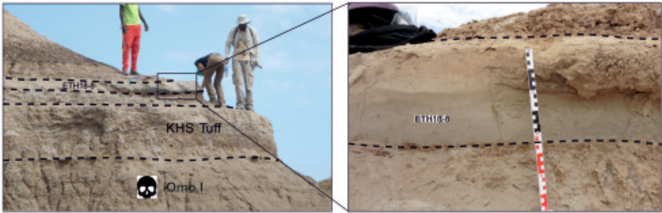
Рис. 2. Положение горизонтов тефры (KHS Tuff и ETH18-8) в разрезе KS (район Омо–Кибиш) (Vidal et al., 2022).

Новые исследования (Vidal et al., 2022) позволили существенно уточнить эти выводы. Было проведено детальное изучение геохимии вулканитов Эфиопского рифта (в районах Омо–Кибиш, Консо [Konso] и Гадемотта) для точного установления источника тефры KHS. Авторы предположили, что наиболее вероятные из них – вулканы Шала (Shala) и Корбетти (Corbetti), находящиеся на расстоянии около 350–370 км от Омо–Кибиш (рис. 1). Согласно химическому составу основных окислов и элементов-примесей, источником тефры KHS является игнимбрит горизонта Qi2 вулкана Шала (продукт пеплового потока с высокой температурой, в результате чего частицы «спекаются» в твёрдую массу). По данным аргон–аргонового датирования, его возраст составляет в среднем 233 \pm 22 тыс. лет. Дата перекрывающего пепла ETH18-8 – около 177 \pm 8 тыс. лет (рис. 2–3).