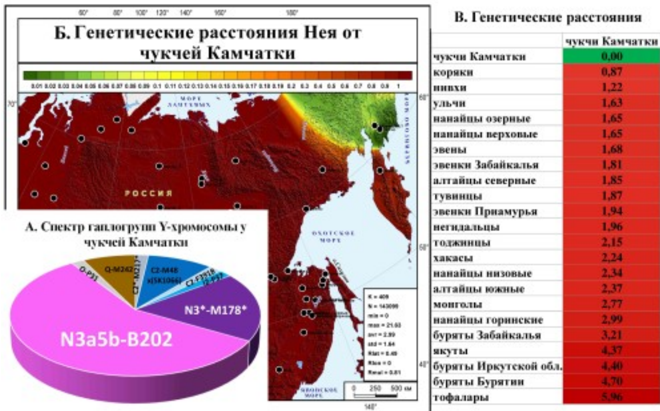
Рис. 1. Характеристика генофонда чукчей Камчатки по всему спектру гаплогрупп: А. Спектр гаплогрупп Y-хромосомы у чукчей Камчатки Б. Карта генетических расстояний Нея от чукчей Камчатки в масштабе Северо-Восточной Азии. В. Таблица генетических расстояний Нея от чукчей Камчатки до популяций Сибири.

На филогенетической сети гаплогруппы N3 – N3a5b-B202 прослеживаются две ветви, образцы которых распределены по двум кластерам: \alpha и \beta . Кластер \alpha включает образцы чукчей Камчатки и Чукотки, коряков Камчатки и Магаданской области и ительмена, обладает выраженным гаплотипом основателя (встречен преимущественно у чукчей). В кластере \beta встречены преимущественно чукчи Камчатки, в меньшем числе – чукчи и эскимосы Чукотки, а также единичные образцы коряков (Камчатки и Магаданской области). Гаплотип основателя кластера \beta обнаружен у магаданского коряка, чукотского чукчи и эскимоса. Датировка всей сети N3a5b-B202 – 1500 \pm 500 лет, кластера \alpha – 600 \pm 250 лет, кластера \beta – 1400 \pm 800 лет.