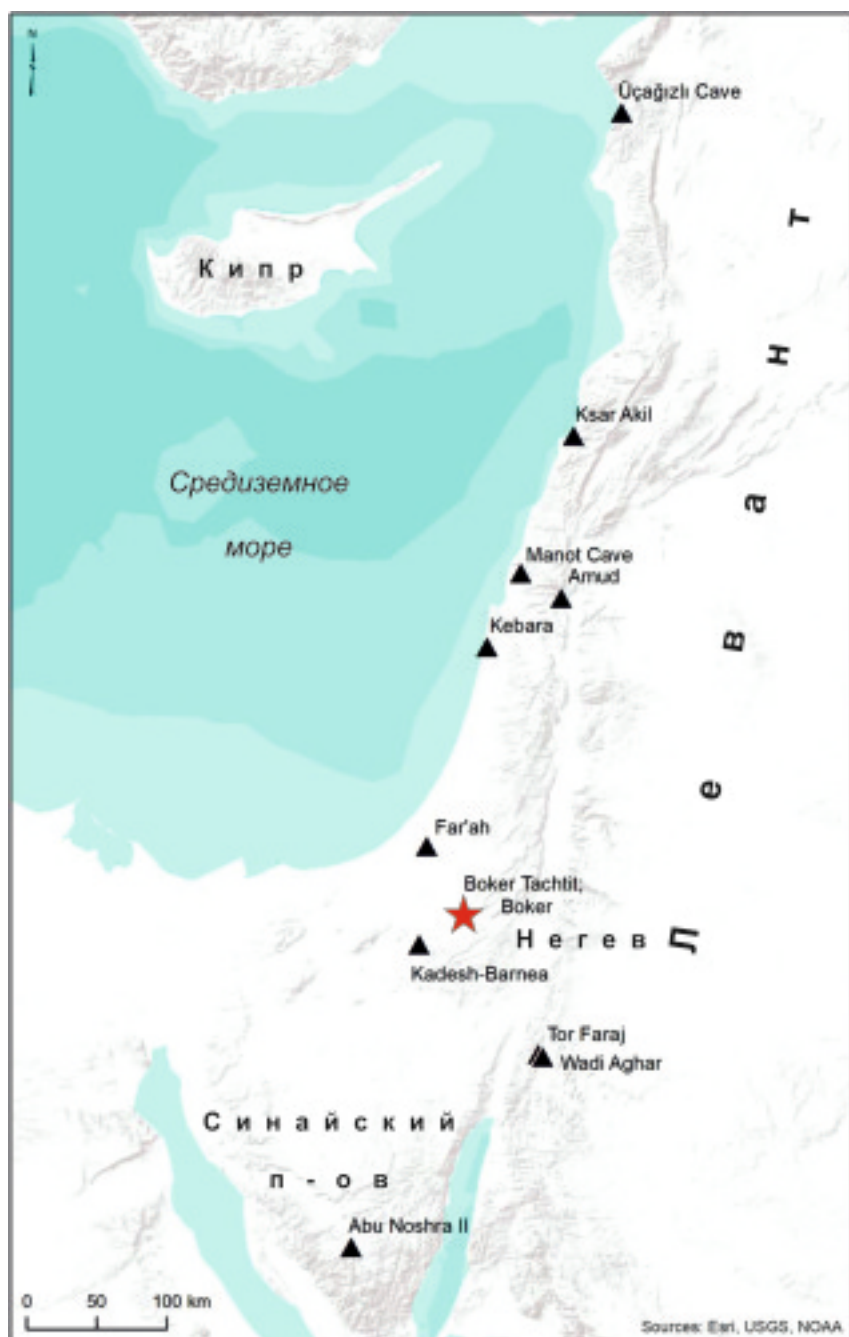
Рис. 1. Карта Леванта с памятниками финала среднего палеолита и начала верхнего палеолита (Boaretto et al., 2021); Бокер Тахтит отмечен красной звездочкой.

На основании работ, проведенных на Бокер Тахтите в 1970-х гг., каменный инвентарь начального верхнего палеолита (Initial Upper Paleolithic, IUP) был определен как эмиран, или эмирийская культура, самая древняя из культур верхнего палеолита (см. Вишняцкий, 2008, с. 95–104). Его хронология определялась на основе ^{14}\text{C} даты 44\,980 \pm 2420 лет назад, соответствующей очень широкому календарному интервалу – 43 260–54 630 калиброванных лет назад (далее – кал. л.н.); среднее значение – около 48 950 кал. л.н. Этот возраст по сути перекрывается со временем существования самого раннего памятника верхнего палеолита в северной Азии, Кара-Бом (Горный Алтай, Сибирь): 43 180–48 630 кал. л.н. (см., например: Kuzmin, 2007, p. 762).