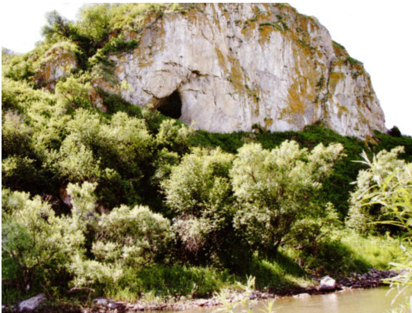
Чагырская пещера.

перевод Надежды Маркиной, редакция Ярослава Кузьмина