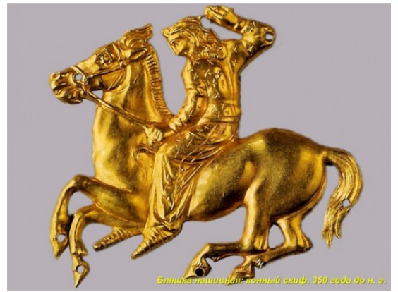
Бляшка нашивная: конный скиф, 350 года до н. э.