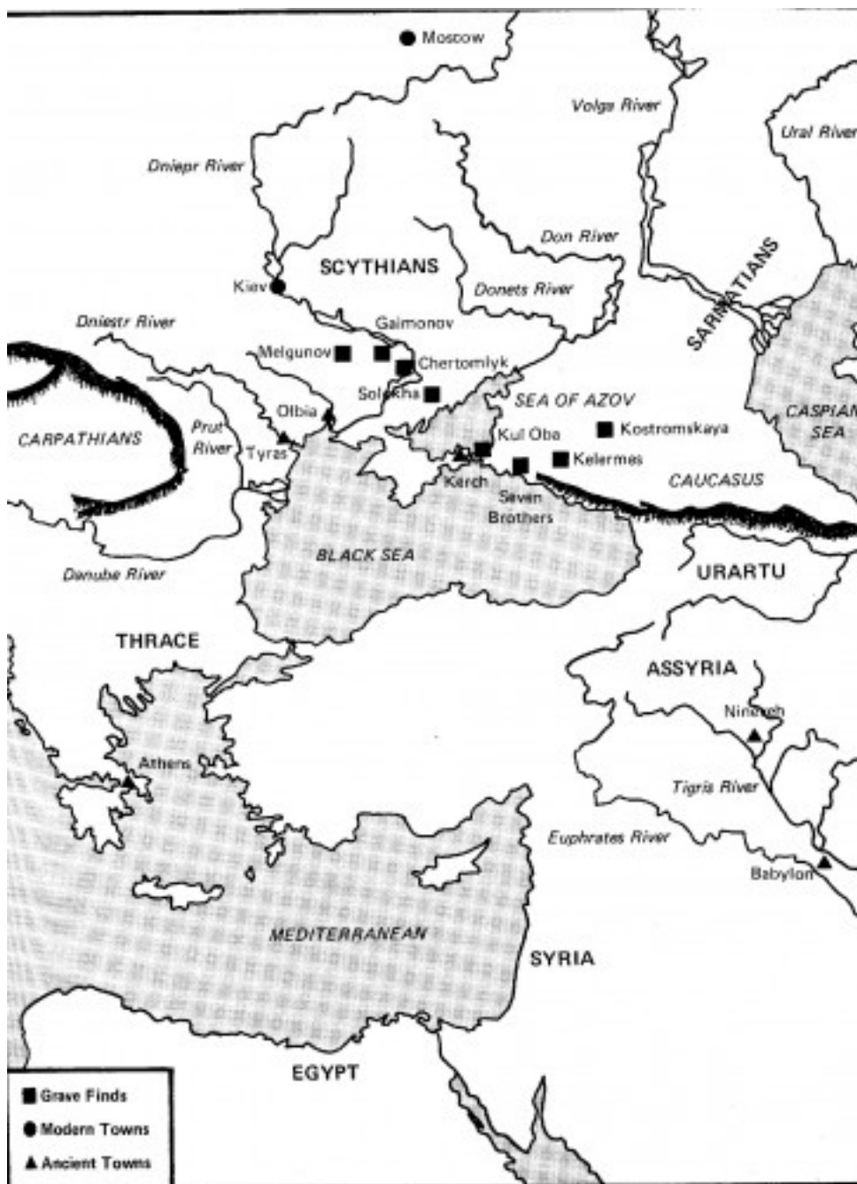
Карта расположения Скифии.