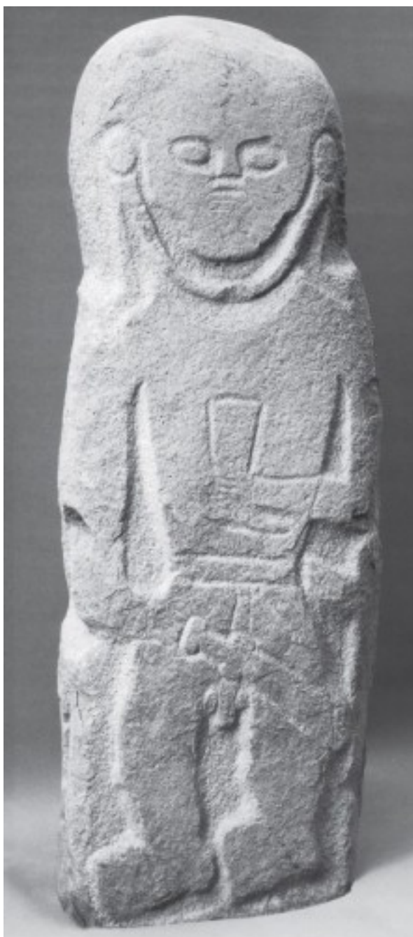
1. Каменное скифское изваяние. Одесская обл., V в. до н. э.