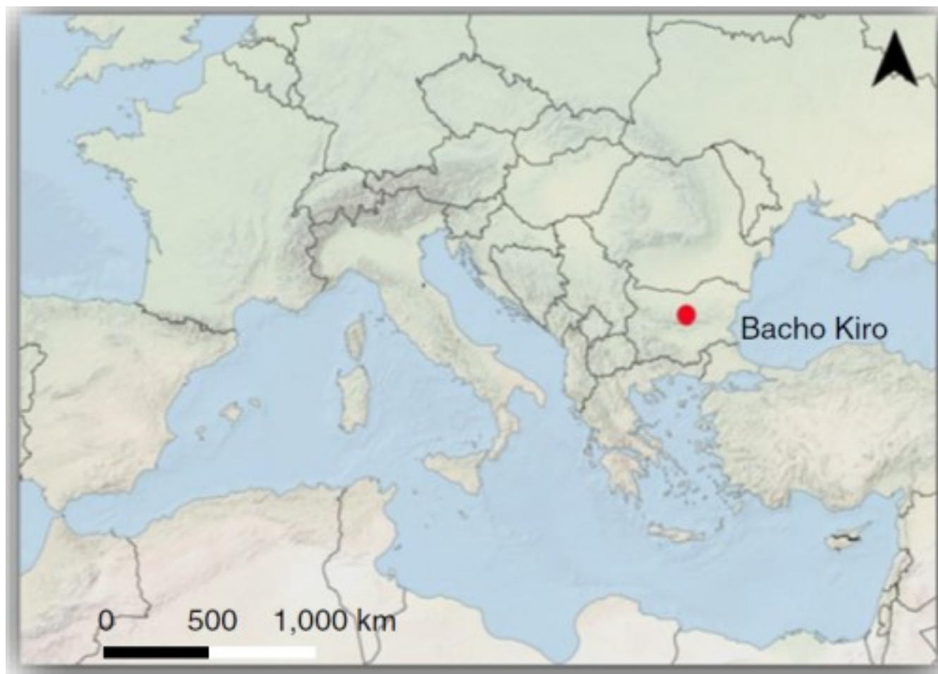
Географическое положение пещеры Бачо Киро.

Пещера Бачо Киро находится на северном склоне Балканских гор, примерно к 70 км к югу от Дуная. В 1970-х годах в пещере были найдены фрагментированные костные останки. В их числе был зуб человека (второй нижний моляр), который по разным морфологическим признакам сочетал в себе черты, характерные для неандертальца и для Homo sapiens .