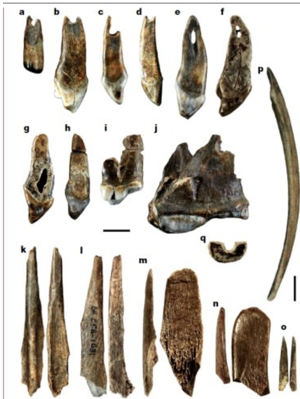
Орудия из кости другие артефакты из пещеры Бачо Киро. В верхнем ряду – подвески из продырявленных клыков пещерного медведя.

Многие фрагменты костей животных хранили следы деятельности человека: характерные царапины, следы обжигания огнем, окраски охрой. Среди артефактов, найденных в том же слое, что и костные фрагменты, были каменные и костяные орудия, а также подвески из продырявленных клыков пещерного медведя. Специалисты считают, что качественный кремний для изготовления орудий люди принесли в пещеру Бачо Киро с месторождения, находящегося на расстоянии 180 км от нее.