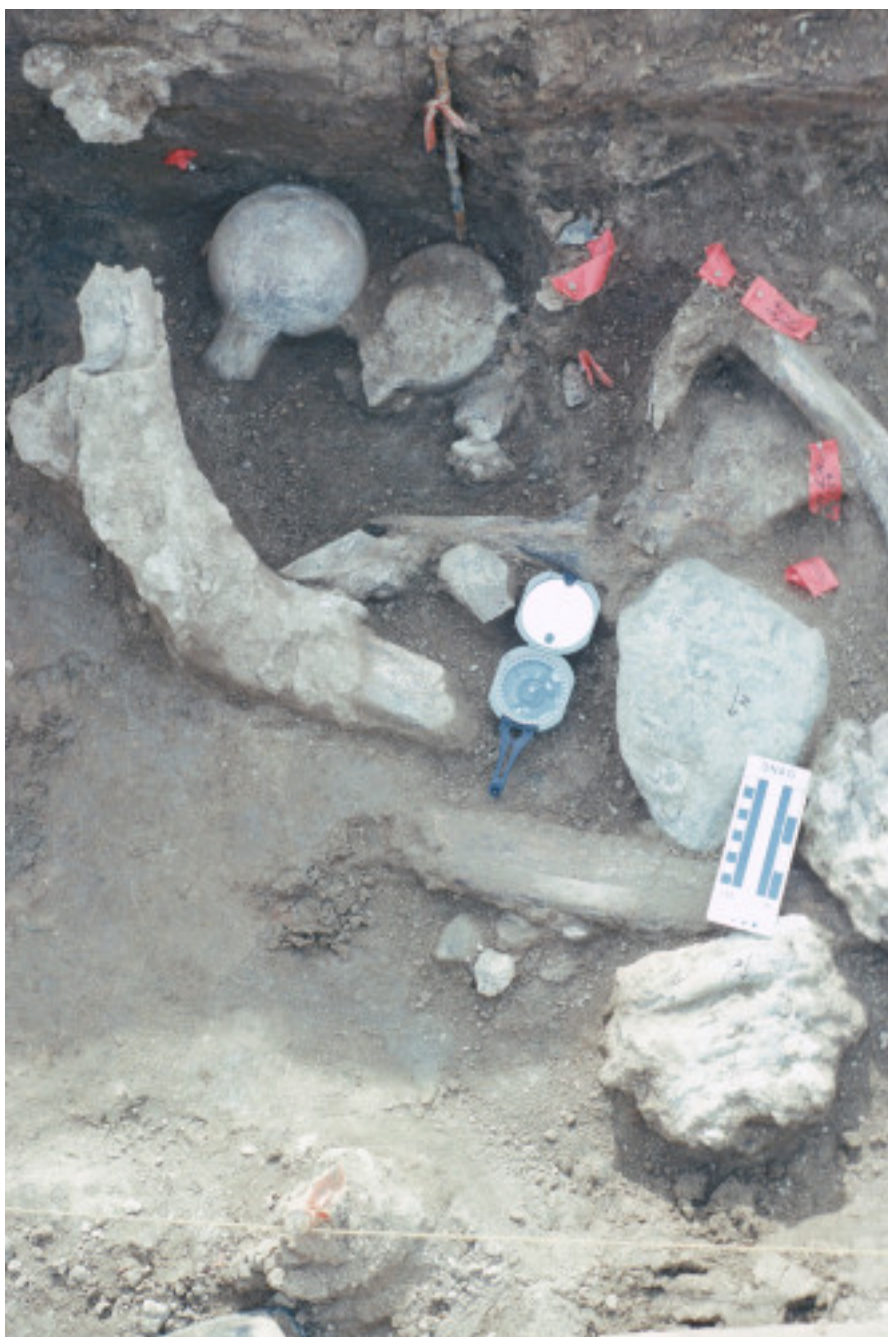
Концентрация обломков костей и камней. Необычно положение лежащих рядом отломанных головок бедра. В правом нижнем углу — зуб мастодонта.