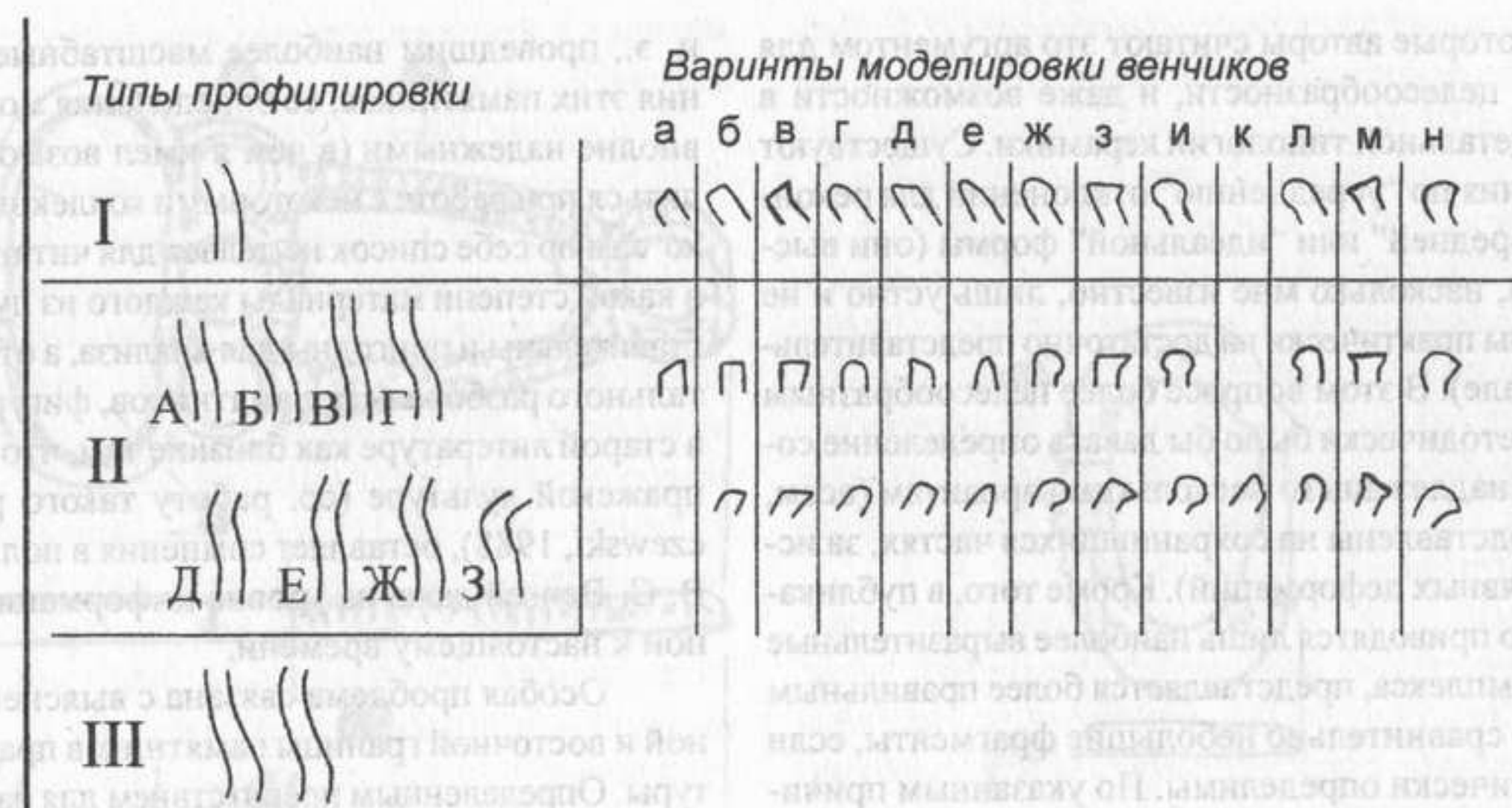
Рис. 1. Схема типологии венчиков пражской культуры. Каждый вариант описывается и шифруется сочетанием характера профилировки (обозначается заглавной буквой или римской цифрой) и среза венчика (обозначается строчной буквой)

Итак, создание собственной хронологической шкалы для памятников пражской культуры Белорусско-