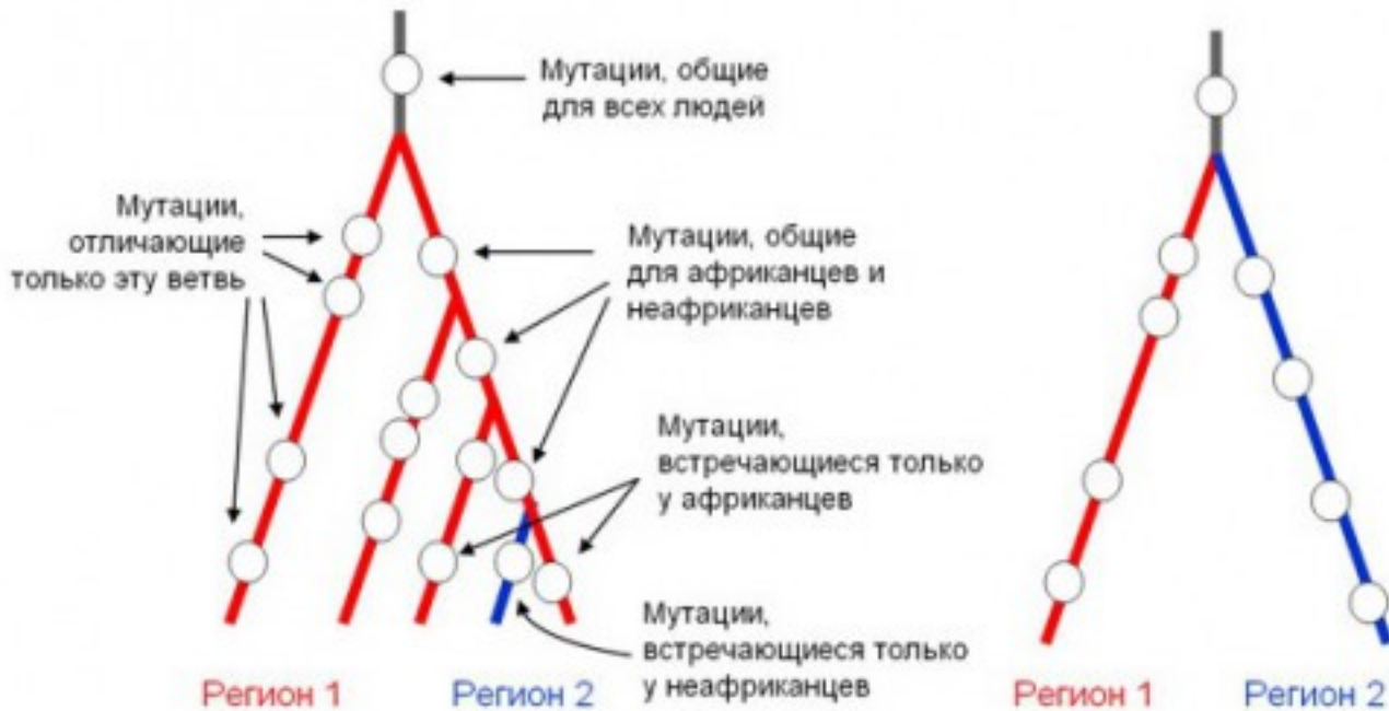
Рис. 1'. Древо гаплогрупп и регионы распространения отдельных ветвей.

Справа на рисунке показано древо, на котором только две ветви. По такому древу невозможно определить регион происхождения — оба региона равновероятны.