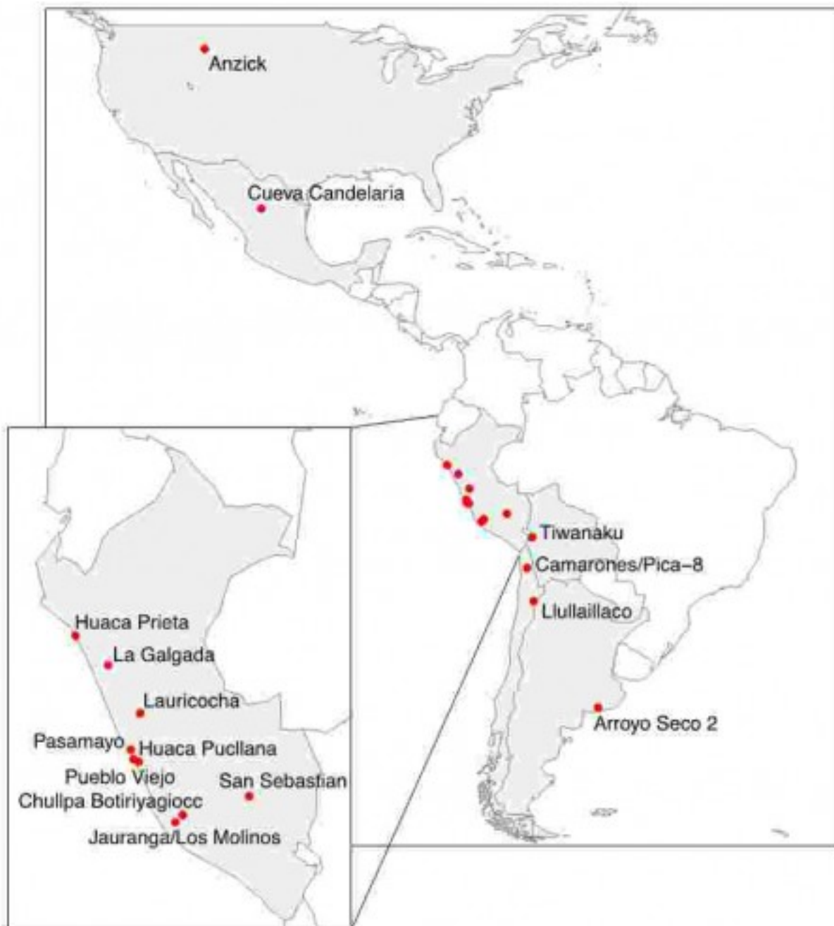
Карта расположения мест находок древних образцов, из которых была выделена мтДНК.

Митохондриальные геномы авторы секвенировали со средним покрытием 112x (цифра показывает, сколько раз был прочитан каждый нуклеотид и характеризует надежность данных), и для древней мтДНК это считается очень хорошим результатом. Выявили 84 гаплотипа, которые относятся к нескольким митохондриальным гаплогруппам (A2, B2, C1b, C1c, C1d, и D1). К их удивлению, среди них не было гаплогруппы D4h3a, типичной для южноамериканских индейцев (хотя большинство образцов происходило из этого региона). Более того, ни один из древних 84 гаплотипов вообще не был представлен в современных популяциях. Применяв байесовский подход, исследователи вычислили для каждой из гаплогрупп A2, B2, C1, D1 и D4h3a время жизни общего предка и подтвердили, что они некогда принадлежали к одной начальной популяции, которая разделилась не позднее 9 тыс. лет назад.