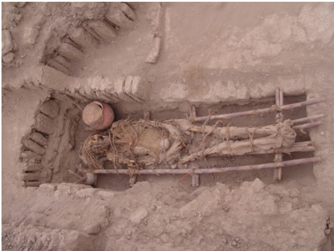
Захоронение, принадлежащее культуре Лима (500-700 лет до н.э.), археологический сайт Huaca Pucllana на территории г. Лима (Перу).

реальном времени ключевых вопросов времени и путей заселения Америки». Авторы подчеркивают, что секвенирование древней мтДНК – это менее затратный способ реконструировать исторические миграции по сравнению с секвенированием древних ядерных геномов.