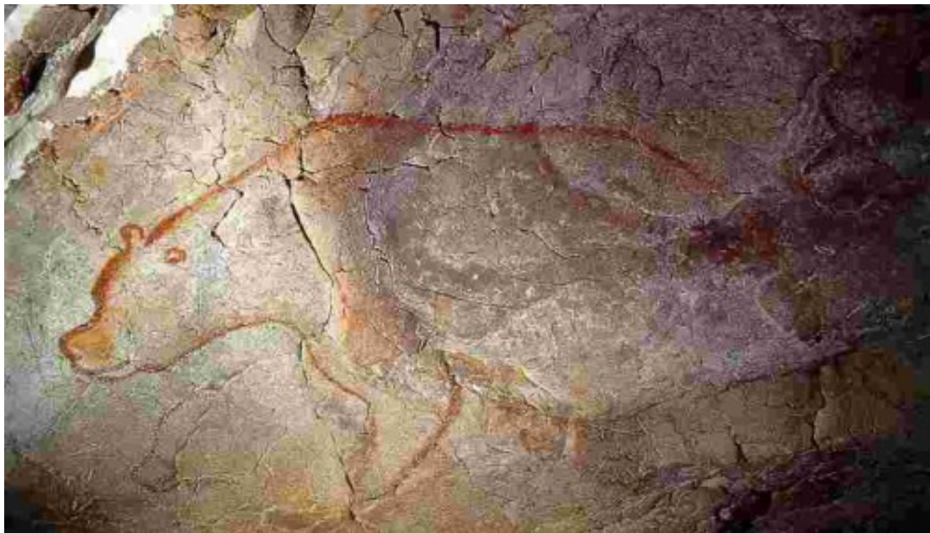
Франция, пещера Шове. Медведь – 32-26 тлн.

Изобразительное искусство – неотъемлемая часть нашей культуры и особая область профессиональной деятельности художников и искусствоведов. Люди давно привыкли к тому, что их всю жизнь и со всех сторон окружают самые разные изображения: рисунки детей и великие шедевры живописи, графики и пластики; иконы и портреты политических лидеров; уличные граффити, пропагандистские плакаты и пошлая реклама. Поэтому редко, кому приходит в голову вопрос: «когда, как и почему люди начали рисовать?» Но среди специалистов (историков, этнографов, психологов и, особенно, археологов), попытки ответа на этот вопрос, продолжаются уже больше ста лет и успеха пока не достигли. Вопрос оказался крайне сложным (Soffer, Conkey, 1997).