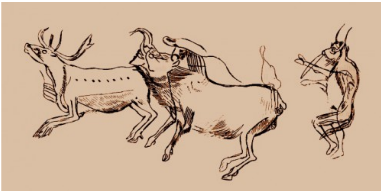
Франция, пещера Труа-Фрер, прорисовка – 13 тлн.

Стала сомнительной роль труда в появлении изображений (Шер, 1994). Самое интересное то, что всегда было на виду: психологически очень близким оказались некоторые стороны процесса происхождения языка и членораздельной речи, как второй сигнальной системы. И искусство, и речь присущи только человеку, появились будто из ничего в эпоху верхнего палеолита и то, и другое относится к сфере информации, речь к логической, словесной информации, а рисование – к образной. Правда, у речи все же был какой-никакой эволюционный предок – набор звуковых сигналов животных, включая ранних гоминид (первая сигнальная система). Но в силу генетической природы этих сигналов и особенностей морфологии голосового тракта палеоантропов данное сходство чисто внешнее.