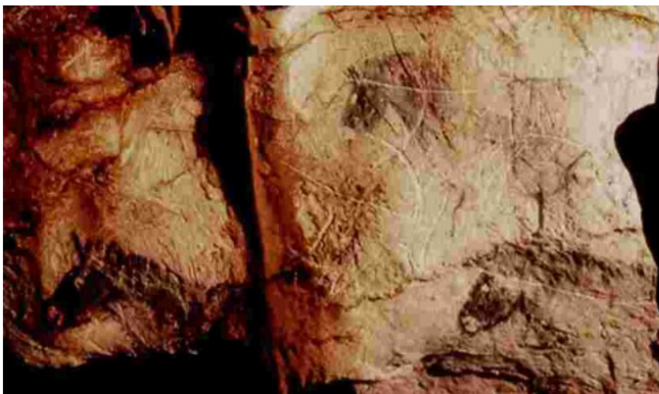
Франция, пещера Коскер – 27-26 тлн.

Лет эдак 30 назад у меня возникла туманная догадка. Эволюция (а, возможно, и мутация) была, но она была латентной и проходила в глубине структур головного мозга у эволюционных предшественников человека современного антропологического вида – H. sapiens . Никаких оснований, для того, чтобы превратить эту догадку в гипотезу у меня долго не было. Первое публичное выступление с этой догадкой было неудачным (Шер, 1990). Дальнейшие раздумья привели к мысли, что если догадка верна, то чисто историко-археологическими, т.е. гуманитарными методами ее подкрепить не удастся. Нужно обращаться к данным психофизиологии.