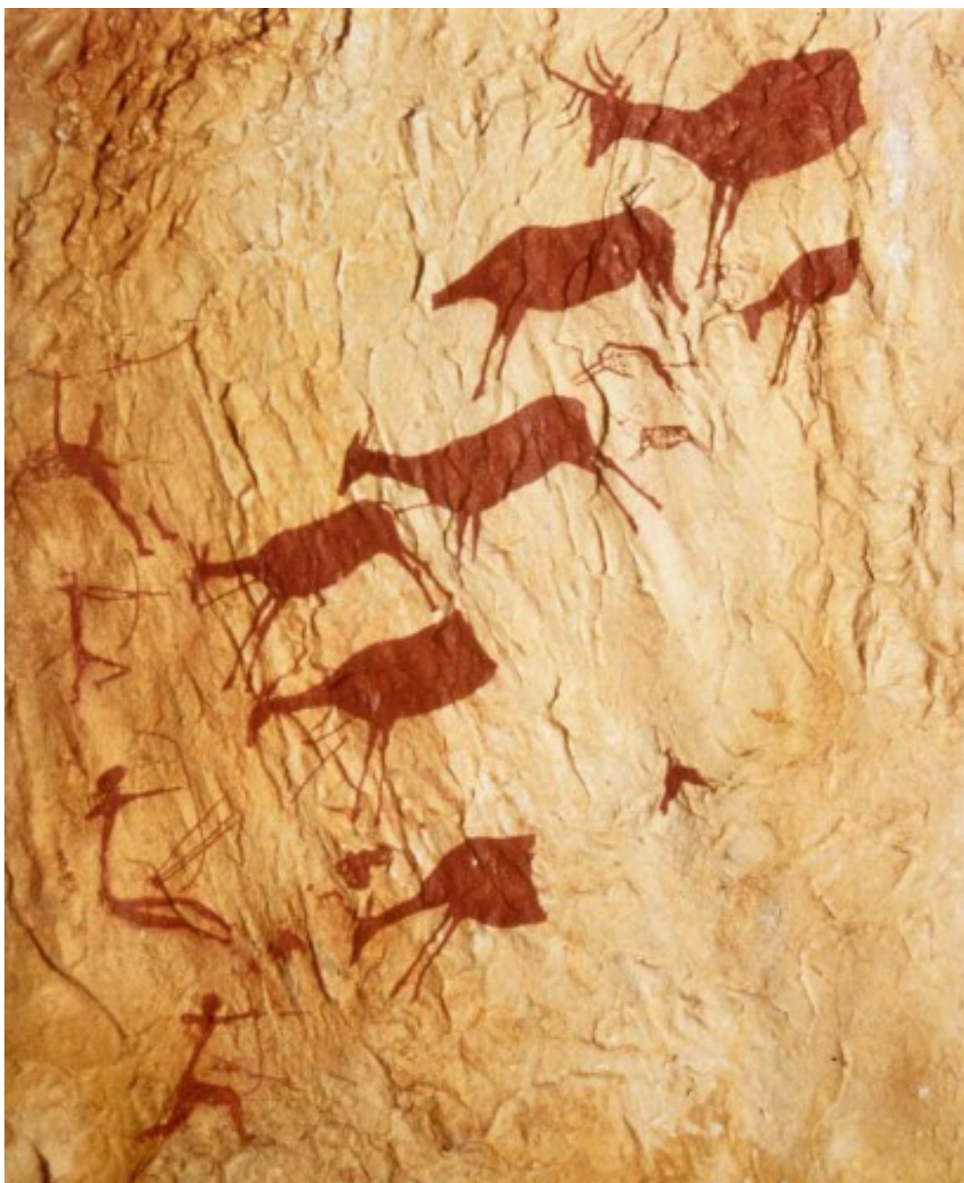
Испанский Левант. Охота. 5-4 тлн.