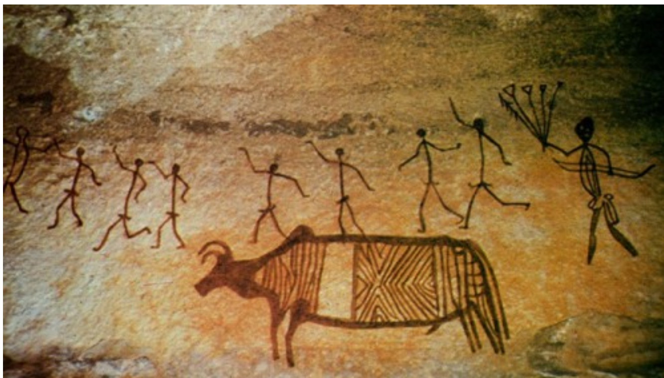
Индия. Бхимпетка. Ритуал (?). 4-3 тлн.

или почти ничего не изменилось, то последовательность освоения современными детьми разговорной речи как раз свидетельствует о том, что в начальный период (1 – 1.5 года) дети осваивают существительные и определения и только позднее – глаголы. «Первые слова ребенка, в отличие от «гуления», не выражают его состояния, а обращены к предмету и обозначают предмет.»(Лурия, 1979: 35; см. также: Линден, 1981: 42; Бурлак, 2012: 128 – 129 и др.).