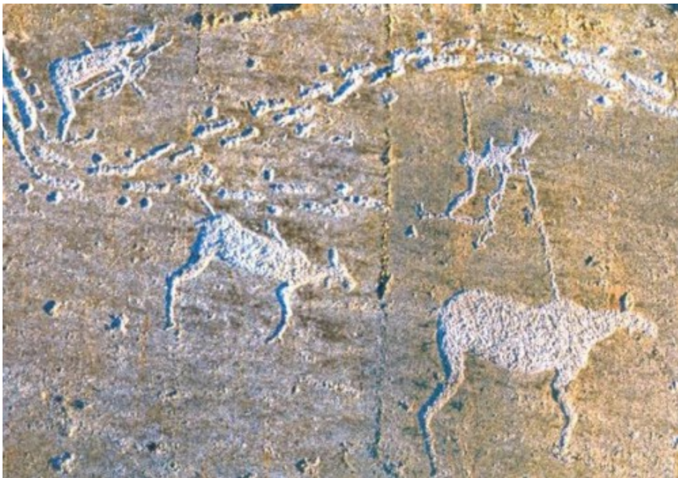
Карелия, Залавруга. Охота на лосей. 4-3 тлн.

Думается, что это не метафора, а реальное сходство в «механизмах» действия естественного языка как средства выражения понятий и логики, с одной стороны, и искусства как средства выражения неязыковой, а образной информации и интуиции – с другой. Вопрос о языке первобытного искусства и об образном «разноязычии» был поставлен в работе (Шер, 1980), которой предшествовал раздел об изобразительных памятниках в другой книге (Каменецкий и др., 1975: 62-71; 2-е изд. 2013: 80-86). С тех пор он время от времени всплывал в моем сознании, но от этого не приобретал достаточной четкости.