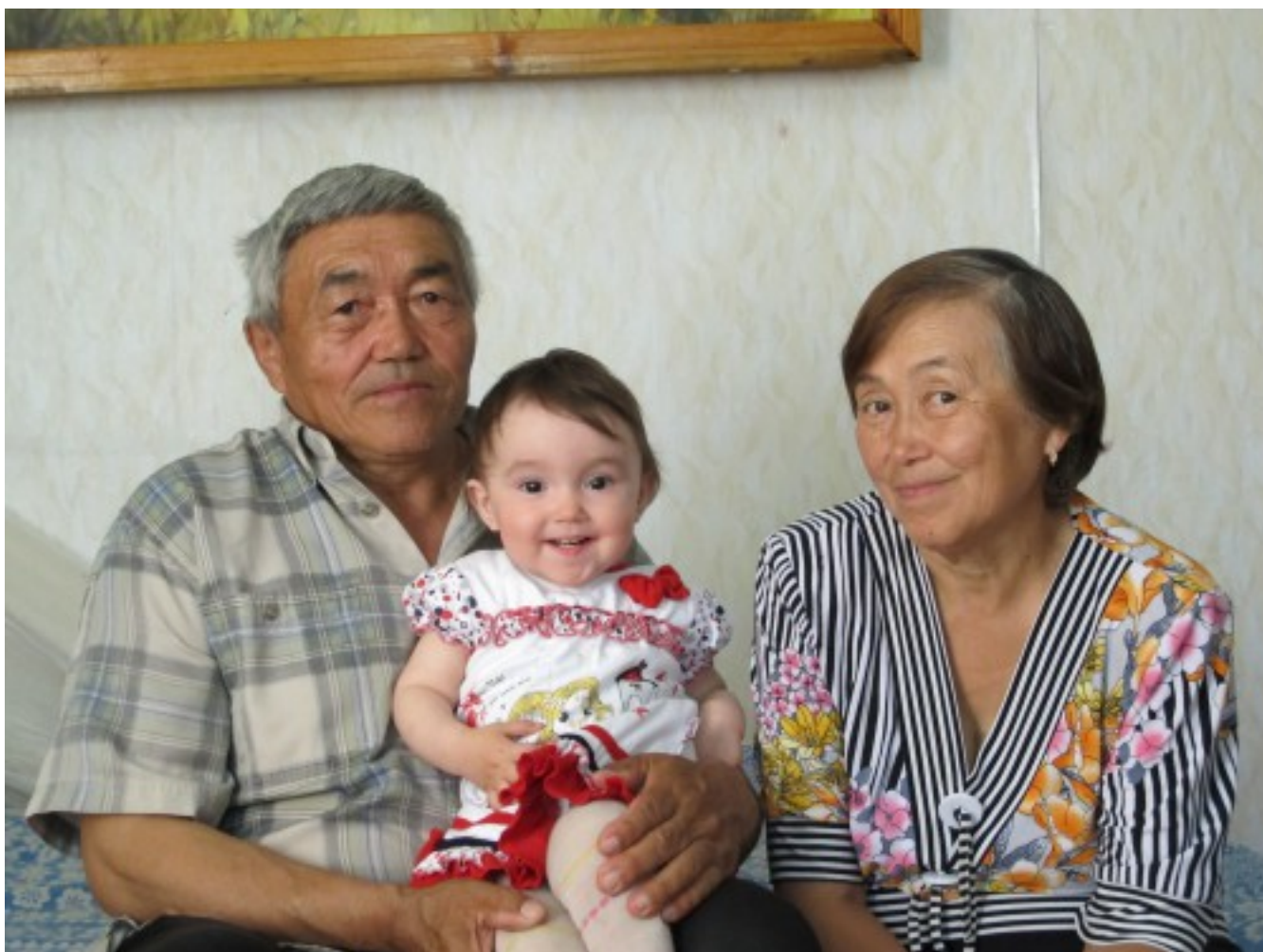
Семья кетов из Верхнеимбатска

Используя панель GenoChip, авторы также проанализировали около 3300 митохондриальных и 12000 Y-хромосомных SNP. Генотипирование по мтДНК показало, что у кетов доминирует митохондриальная гаплогруппа U4. Она же отмечается с частотой более 10% в культуре ямочной керамики, у древних европейских охотников-собирателей, у сибирцев бронзового века, у современных селькупов, нганасанов, тубаларов, манси, а также у ряда народов Пакистана. В целом ее частота хорошо коррелирует с кето-уральским предковым вкладом. У мальчика с Мальты выявлена предковая гаплогруппа U. Суммируя перечисленные выше данные, авторы высказывают осторожное предположение, что гаплогруппа U4 является маркером одной из ветвей древних северных евразийцев ANE.