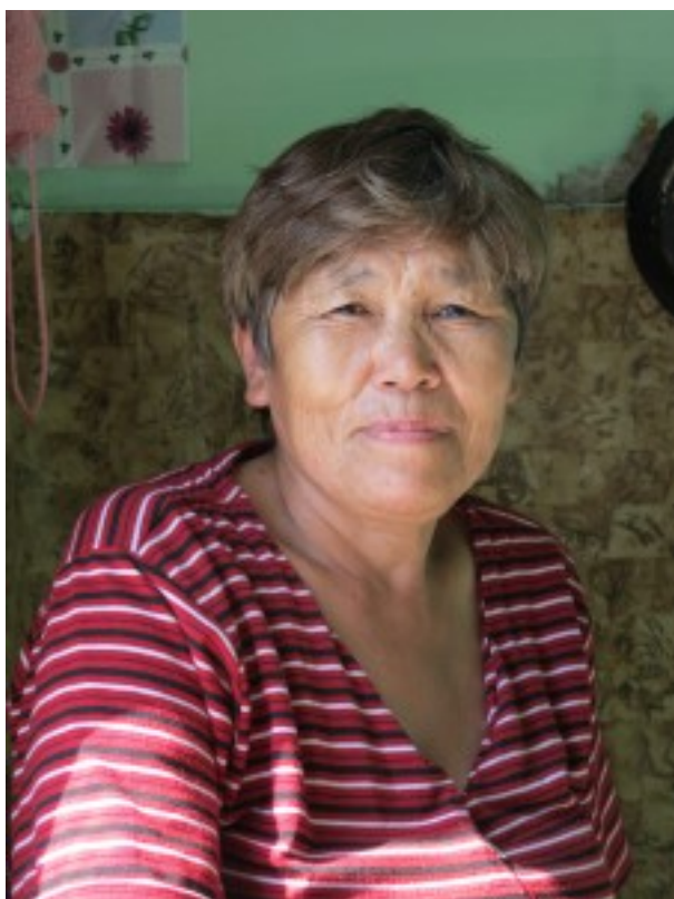
Жительница поселка Бахта