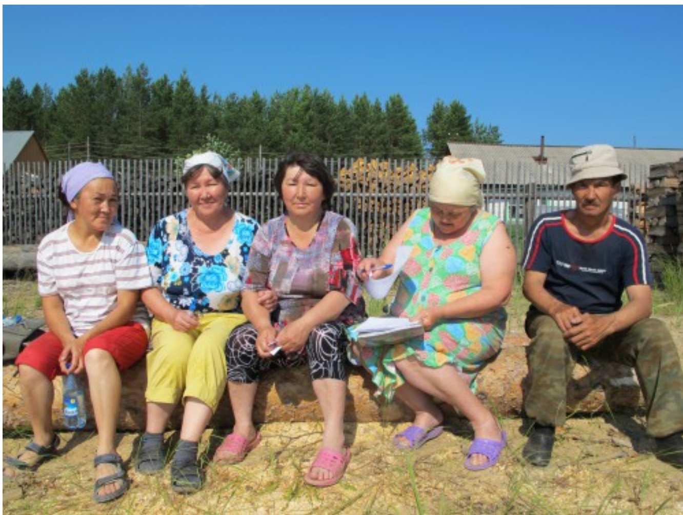
Жительницы поселка Келлог

Они подтвердили исследованное ранее происхождение культуры саккак, показав генетическое сходство ее представителей с популяциями Берингии (эскимосы, инуиты, алеуты, коряки) и с предковыми популяциями из Сибири. Так что, по заключению авторов, культура саккак, и в целом, палеоэскимосы, это результат отдельной, относительно недавней миграции в Америку.