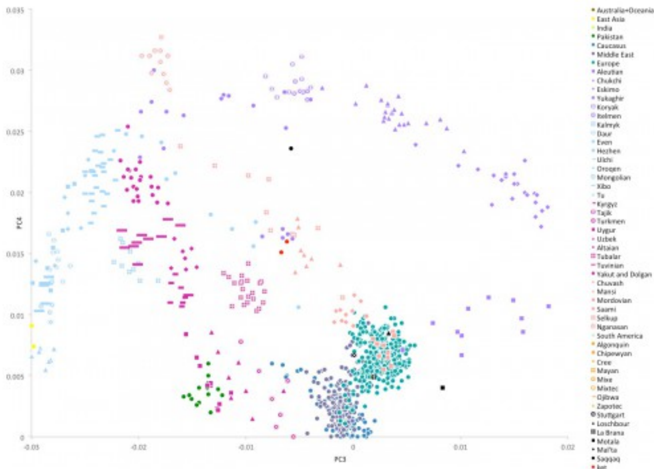
График анализа главных компонент (PC3 vs. PC4). Каждая точка соответствует одному индивиду. Кеты обозначены красными точками. Обозначения популяций — справа.

Согласно анализу десяти главных компонент, кеты (красные точки) наиболее близки с селькупам, нганасанами и юкагирами, и являются самой близкой современной популяцией для генома Саккак (черный кружок). Отметим, что приведенная на рисунке проекция лишь частично отражает расстояния в десятимерном пространстве.