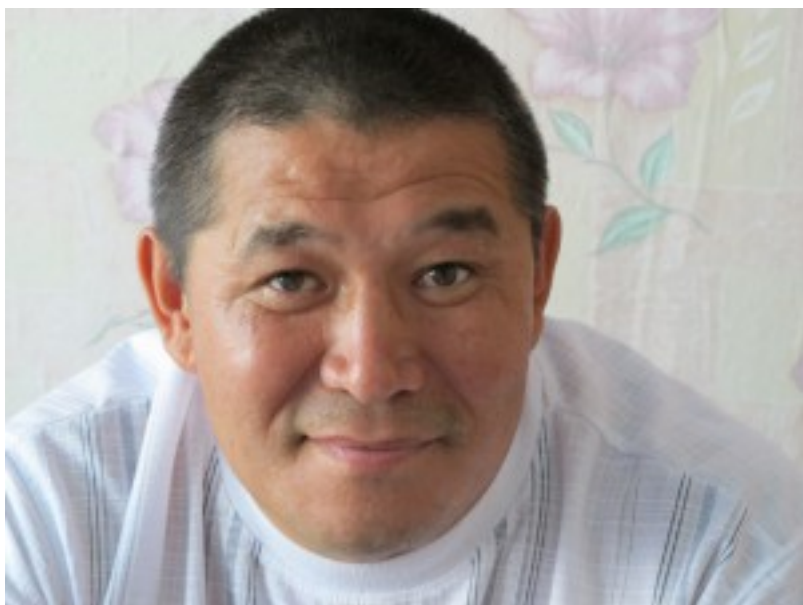
Житель поселка Бахта

В работе были изучены 46 образцов ДНК кетов, не являющихся родственниками, и 42 образца окружающих уралоязычных этнических групп (нганасаны, энцы, селькупы). Их генотипировали по 130 тыс. аутосомных SNP (однонуклеотидным полиморфизмам), определили Y- и мтДНК гаплогруппы и два генома полностью секвенировали с высоким покрытием. По