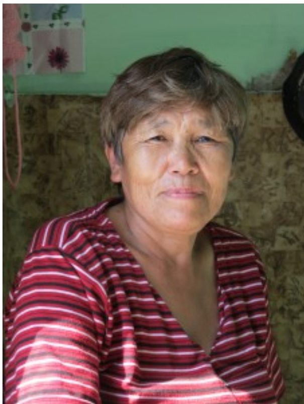
Жительница поселка Бахта