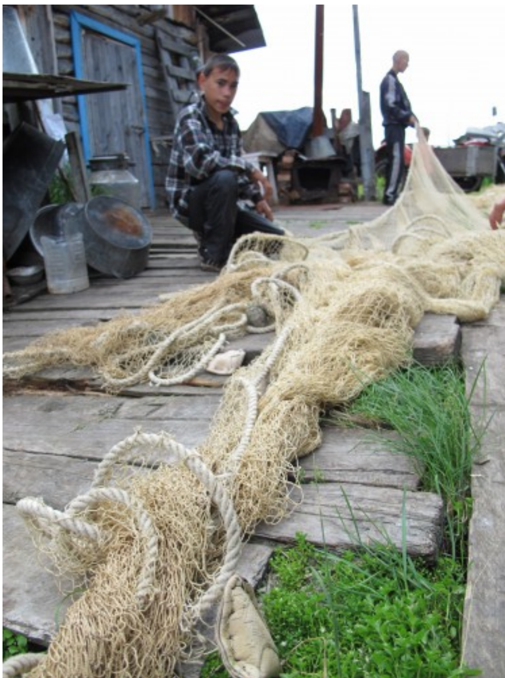
Деревня Мадуйка, самое северное место жительства кетов

Кеты, живущие в бассейне Енисея, — это один из немногочисленных оставшихся коренных народов Сибири. До того, как в 1930-х годах их заставили перейти к оседлому образу жизни, кеты, как считают, были последними кочевыми охотниками-собирателями сибирской тайги. В течение нескольких веков кеты и окружающие их родственные народы енисейской языковой семьи с севера находились под давлением оленеводческих племен (энцев и ненцев), с востока — эвенков, с юга — тюркоязычных скотоводов. Завоевание Сибири русскими, с конца XVI века, принесло новые инфекционные болезни, например, в XVII в. случилась эпидемия оспы. В XX в. в советское время, кетов насильственно прикрепили к поселкам, нарушив их кочевой образ жизни. Оседлые кеты интенсивно смешивались с русскими и с другими коренными народами Сибири, что вело к утере их языка, генофонда и культуры. К настоящему времени кеты (или кетб, как они себя нередко называют) проживают в нескольких поселках Туруханского района Красноярского края, всего около 1200 человек.