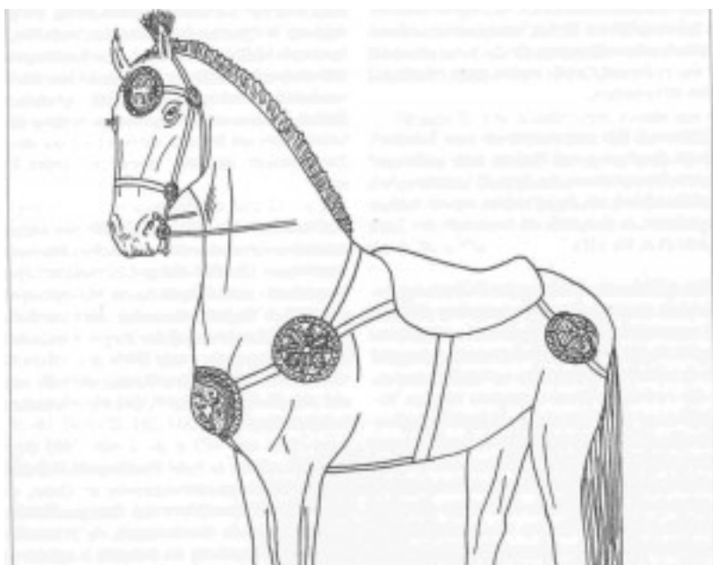
Второй набор фаларов (по В.И. Мордвинцевой)

Весь фокус в том, что эти наборы имеют очень четкое распределение на карте. Фалары первого набора распространены к востоку от Дона – в Волго-Донском междуречье и Предкавказье, а также за Волгой (карта 1). И только наш Садовый из этого набора расположен на правом берегу Дона, то есть чуть западнее его. Фалары же второго набора расположены к западу от Дона – они рассеяны по всей Украине и заходят в Молдавию, и только два комплекса из этого набора найдены в Прикубанье (карта 2).