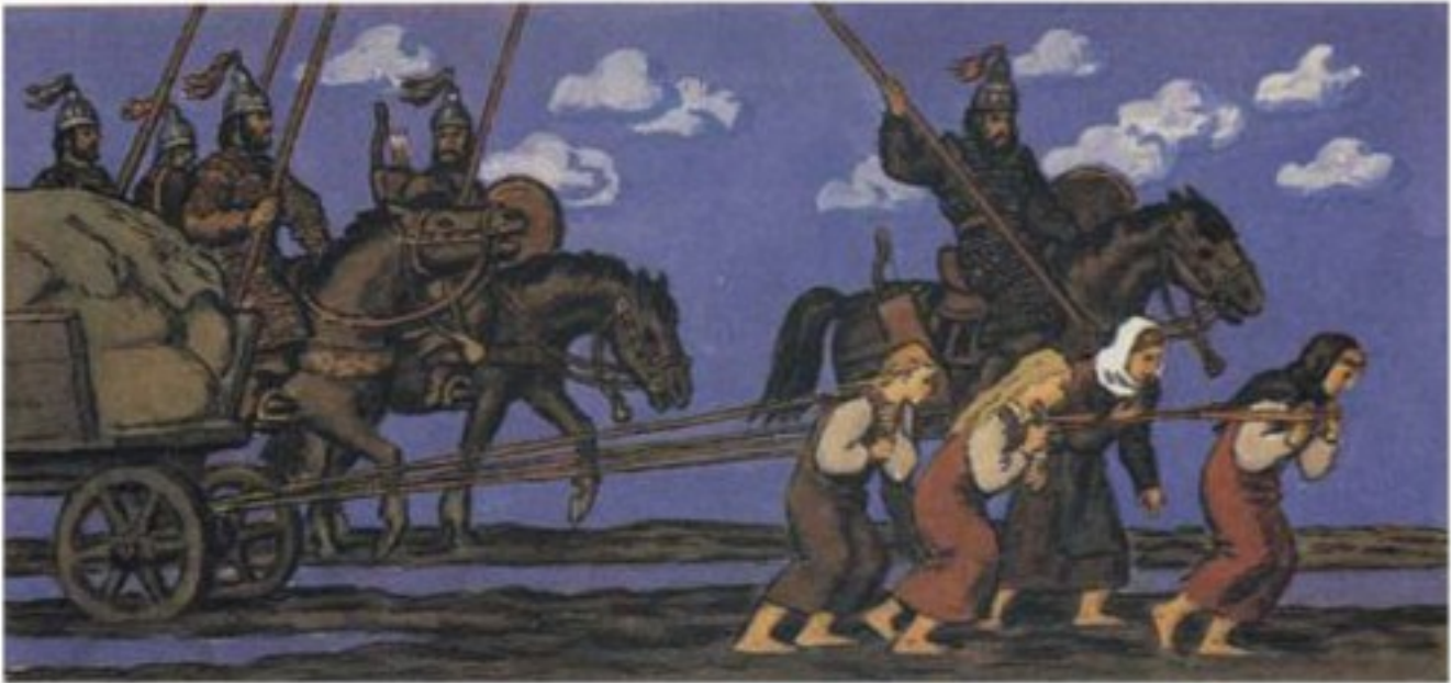
Авары и женщины-дубебки (картина неизвестного художника).

Обычный сброд из числа бывших фракийцев, готов, кельтов, сармат и уведённых в гуннский плен римлян. Это был не единственный термин для данных людей, некоторое время использовались и другие названия, например, «скамары». Но этноним «склавины» с корнем «склав», то есть, по-среднегречески — «раб», был весьма понятен ромеям. Подразумевалось, что эти люди – потомки гуннских рабов, кем они в основной массе и являлись. Разумеется, по-славянски эти люди не говорили.