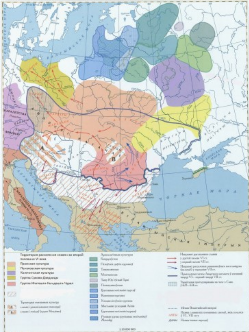
Территория расселения славян в VI веке и границы аварского каганата