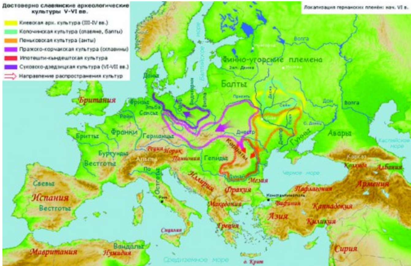
Карта распространения археологических культур V-VI вв., связываемых со славянами, по книге академика В. Седова «Славяне в раннем Средневековье» (1995).

Локализация германских племён: нач. VI в.