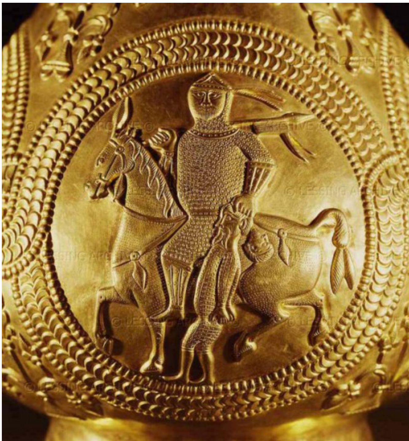
Фрагмент золотого сосуда из клада в Надь-Сент-Миклош: «аварский всадник ведёт пленного византийца».

Широкому распространению славянского языка на окраинах Аварского каганата способствовал целый ряд факторов. Эпидемии бубонной чумы и проказы, от которых у пришельцев не было иммунитета, физически уничтожили большую часть аварской орды. Ослабленное болезнями войско на рубеже VI-VII веков потерпело целый ряд сокрушительных поражений от византийцев. Количество аварских мужчин уменьшилось в разы. Одновременно с этим пала Византийская империя (восстание Фоки и последующая гражданская война), территория которой на Балканах сократилась до окрестностей двух городов: Константинополя и Фессалоники. Аварский каганат лишился главного конкурента и на два с лишним века стал мощнейшей державой на Востоке Европы.