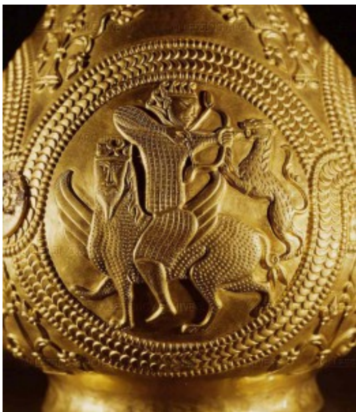
Еще один фрагмент золотого сосуда из клада в Надь-Сент-Миклош.

«Сыновья гуннов», как их называет летопись, выработали свой собственный стиль одежды и украшений. Археологам он известен под именем «мартыновского»: пальчатые фибулы, наборные пояса, похожие на аварские, накладки в виде фантастических животных («невиданных зверей»). Вместе с тем, в отличие от этнических аваров, мартыновцы не представляли собой замкнутой корпорации. В их ряды вливались представители нижней части общества: юноши, проявившие доблесть, девушки, отличавшиеся красотой. Племена стремились походить не столько на недоступных «небожителей» – аваров, державшихся обособленно, сколько на живших среди них аристократов – «сыновей гуннов». Им подражали, их язык учили. Такое привилегированное положение позволило части «сыновей» уже в первой половине VII века отложиться от Аварского каганата и создать собственное царство Само. Но большинство мартыновцев продолжало служить аварам.