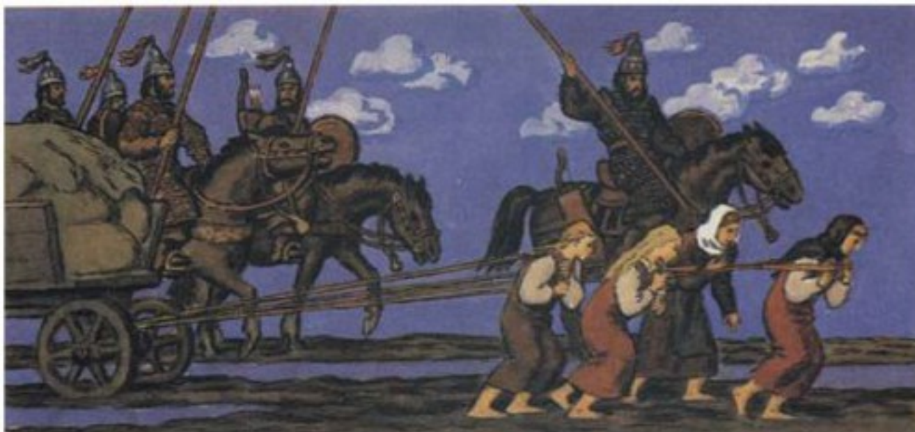
Авары и женщины-дубеки (картина неизвестного художника).

Обычный сброд из числа бывших фракийцев, готов, кельтов, сармат и уведённых в гуннский плен римлян. Это был не единственный термин для данных людей, некоторое время использовались и другие названия, например, «скамары». Но этноним «склавины» с корнем «склав», то есть, по-среднегречески — «раб», был весьма понятен ромеям. Подразумевалось, что эти люди – потомки гуннских рабов, кем они в основной массе и являлись. Разумеется, по-славянски эти люди не говорили.