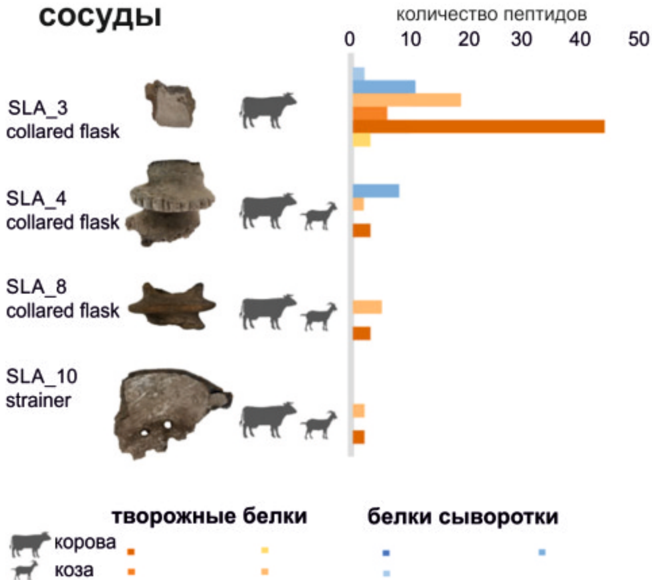
Рис. 2. Белки, определенные в сосудах стоянки Славцинек, с указанием происхождения от разных животных (Evans et al., 2023).

Таким образом, авторам удалось установить, что обитатели стоянки около 5400 лет назад изготавливали творог, который они затем превращали в сыр. Возможно, это связано с тем, что лактоза (молочный сахар), который неолитическое население не могло переваривать (так как не обладало мутацией, обеспечивающей работу фермента лактазы во взрослом возрасте), в этом случае в основном остаётся в сыворотке. Особенно заметно высокое содержание белков творожной массы в археологическом сосуде SLA_3; оно близко к значениям, полученным для экспериментальных (современных) сосудов (рис. 3).