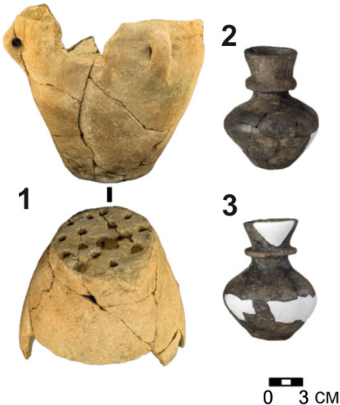
Рис. 1. Сосуды со стоянки Славцеинек, подвергшиеся биомолекулярному анализу. 1 – керамический «дуршлаг»; 2–3 – керамические колбы с воротничком (Evans et al., 2023).

Результаты анализа кратко сводятся к следующему. На образцах археологической керамики обнаружены пептиды, имеющие происхождение как от коров, так и от коз (рис. 2). По археозоологическим данным, в поселении Славцеинек среди домашних животных преобладали коровы (число особей составляло не меньше 45.2%), свиньи (26%) и овцы/козы (16.4%).