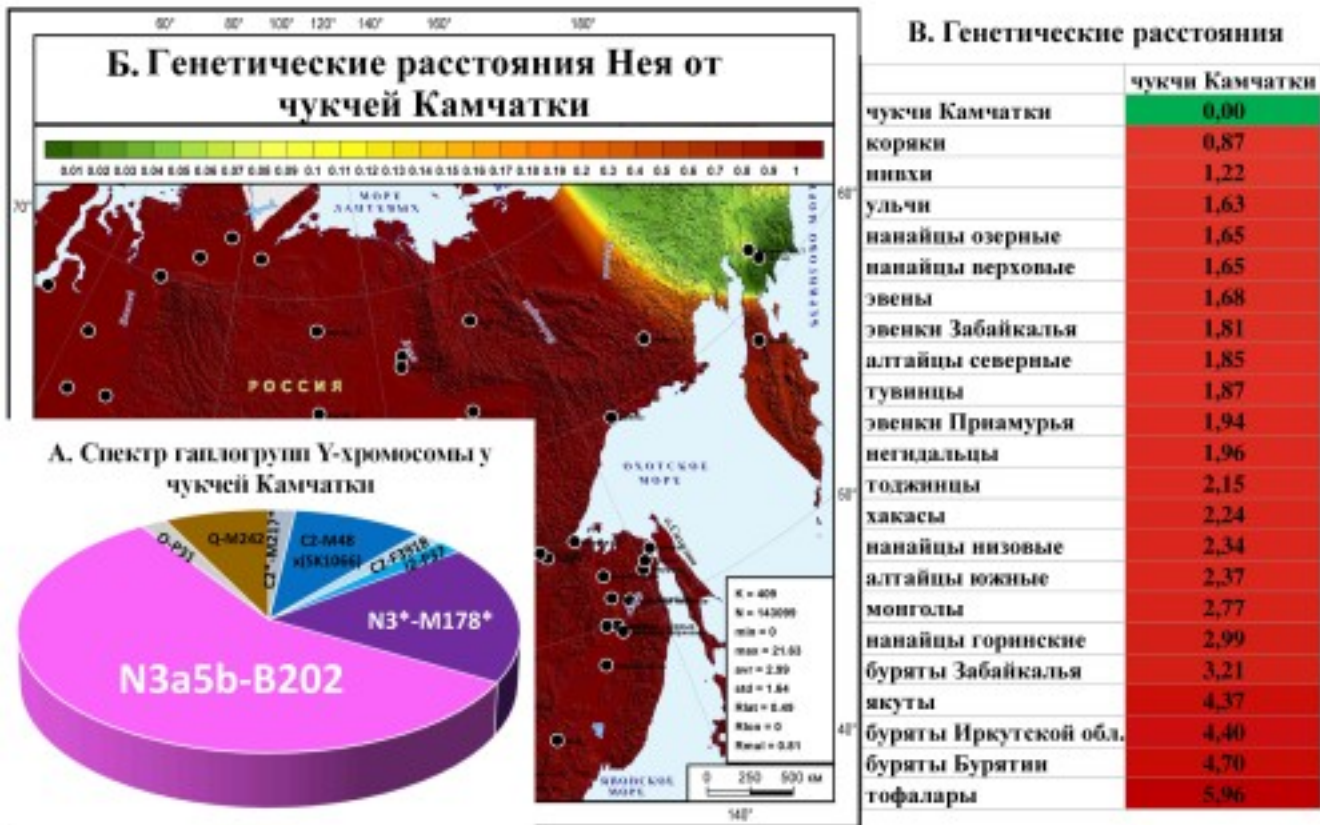
Рис. 1. Характеристика генофонда чукчей Камчатки по всему спектру гаплогрупп: А. Спектр гаплогрупп Y-хромосомы у чукчей Камчатки Б. Карта генетических расстояний Нея от чукчей Камчатки в масштабе Северо-Восточной Азии. В. Таблица генетических расстояний Нея от чукчей Камчатки до популяций Сибири.

На филогенетической сети гаплогруппы N3 – N3a5b-B202 прослеживаются две ветви, образцы которых распределены по двум кластерам: \alpha и \beta . Кластер \alpha включает образцы чукчей Камчатки и Чукотки, коряков Камчатки и Магаданской области и ительмена, обладает выраженным гаплотипом основателя (встречен преимущественно у чукчей). В кластере \beta встречены преимущественно чукчи Камчатки, в меньшем числе – чукчи и эскимосы Чукотки, а также единичные образцы коряков (Камчатки и Магаданской области). Гаплотип основателя кластера \beta обнаружен у магаданского коряка, чукотского чукчи и эскимоса. Датировка всей сети N3a5b-B202 – 1500 \pm 500 лет, кластера \alpha – 600 \pm 250 лет, кластера \beta – 1400 \pm 800 лет.