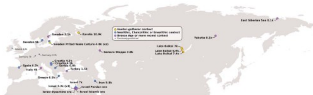
Рис. 1. Расположение мест отбора образцов древних собак на анализ ДНК (Bergström et al., 2020; с изменениями).

Главный результат таков – на основе секвенирования 27 новых геномов древних и исторических собак (рис. 1) удалось установить, что они происходят из одного географического центра, точное положение которого пока неясно; предком этих животных была вымершая популяция волков.