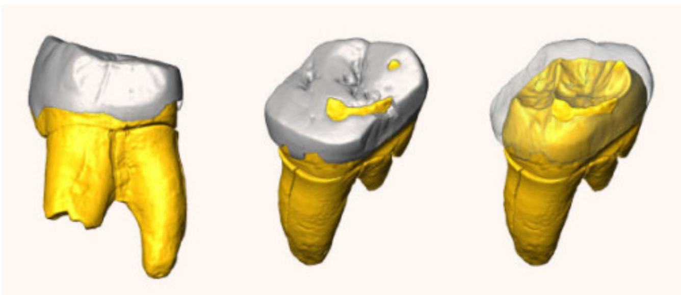
Трехмерная модель моляра Stajnia S5000.

Митохондриальный геном Stajnia S5000 попал в рамки variability неандертальской мтДНК, наиболее близок он оказался к геному неандертальца из Мезмайской пещеры на Кавказе, возрастом 60-70 тысяч лет назад. Оба этих генома на филогенетическом дереве расположились на отдельной ветви по отношению к поздним европейским неандертальцам (из пещер Складина в Бельгии и Хохленштайн-Штадель в Германии).