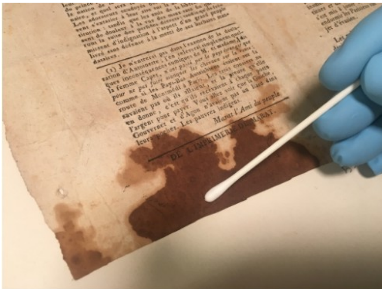
Газета l'Ami du Peuple («Друг народа», окрашенная кровью Марата

Из пятна крови исследователи секвенировали 568 млн фрагментов ДНК (ридов), из которых 74 млн фрагментов оказалось человеческими – их картировали на референсный геном человека. В результате удалось прочитать полный митохондриальный геном с покрытием 4,038x и ядерный геном с покрытием 0,029x.