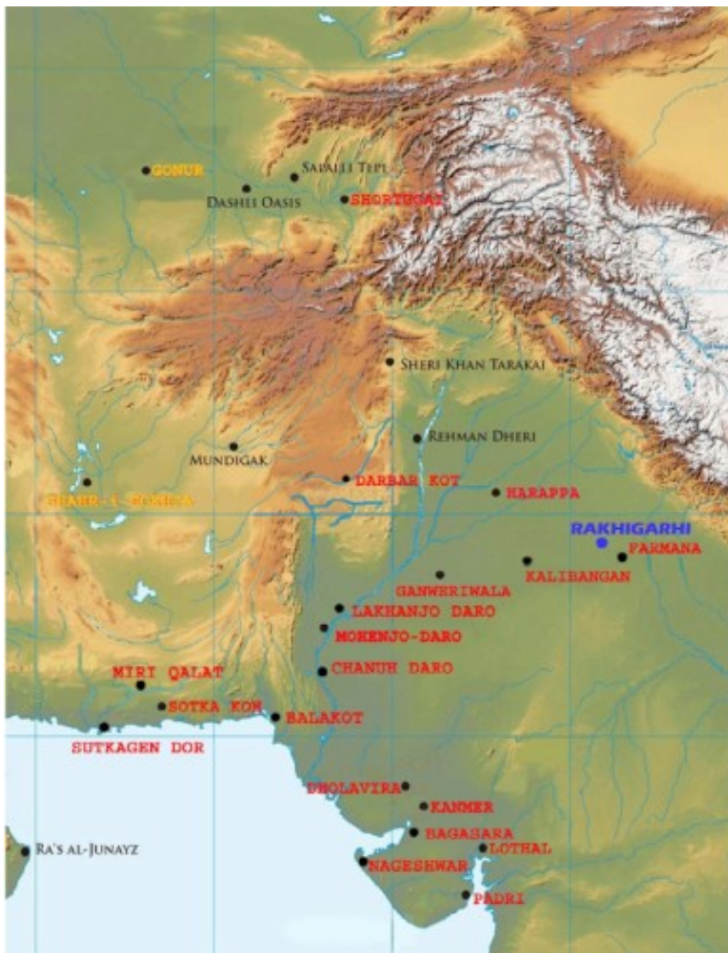
Географическое распространение Харрапской цивилизации. Синим цветом обозначено местоположение Ракхигархи, красным – другие харрапские поселения. Желтым — Гонур-Депе и Шахри-Сухте.

Авторы провели анализ главных компонент и анализ ADMIXTURE, в которые кроме индивида из Ракхигархи включили ранее опубликованные данные трех индивидов из древнего города Гонур-Депе в Туркменистане и восьми – из Шахри-Сухте в Иране. Оба этих древних города существовали одновременно с Харрапской цивилизацией и имели с ней хозяйственно-культурные контакты. Геномы всех 11 индивидов в генетическом пространстве главных компонент расположены вдоль так называемой «индской клины» (см. рисунок).