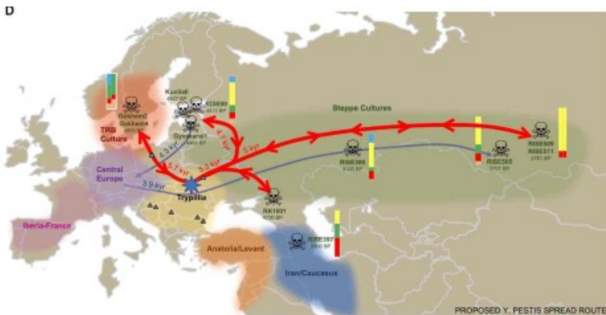
Предложенная модель распространения чумы из мегапоселений трипольской культуры (обозначены синей звездой) по Европе и евразийским степям. Пути миграций Y. pestis показаны красными линиями, стрелки указывают на направления туда и обратно. Цветные спектры обозначают соотношения компонентов в геномах Y. pestis в разных регионах.

Хотя нет непосредственных доказательств патогенности древней Y. pestis , рассуждают авторы, ее присутствие в зубах останков из захоронения указывает на высокое содержание бактерии в крови. Вероятно, именно она стала причиной смерти людей. В геноме бактерии исследователи нашли ген, который указывает на ее способность вызывать легочную чуму – наиболее смертельно опасную разновидность болезни. Ученые выдвигают гипотезу, что эта ранняя форма чумы могла привести к масштабной эпидемии, которая стала одной из причин неолитического упадка в Европе.