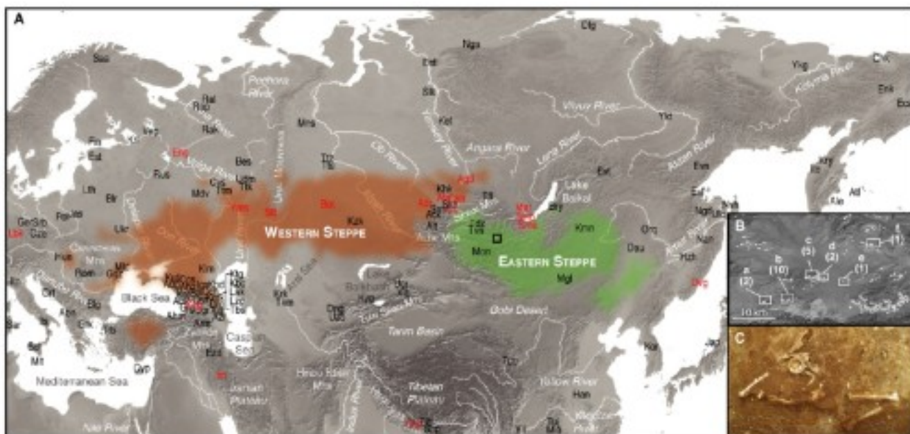
А. Расположение западноазиатских (коричневый цвет) и восточноазиатских (зеленый цвет) степей и положение популяций (красный шрифт), которые анализируются в работе. В квадрате – популяция из Хувсгел, Монголия. В. Расположение могильников, из которых взяты образцы; С. Фото захоронения.

В работе исследованы геномы 22 индивидов из захоронений эпохи поздней бронзы (1380 – 975 лет до н.э.) на севере Монголии (провинция Хувсгел), ассоциированные с археологическим комплексом Deer Stone-Khirigsuur Complex (культура херексуров и оленных камней, от Deer Stone – камень с изображением оленя). Анализ древней ДНК охватил около 1,2 млн сайтов однонуклеотидного полиморфизма (SNP), два генома были полностью секвенированы. У 9 индивидов ученые исследовали состав зубного камня, чтобы проверить, содержатся ли в нем молочные белки.