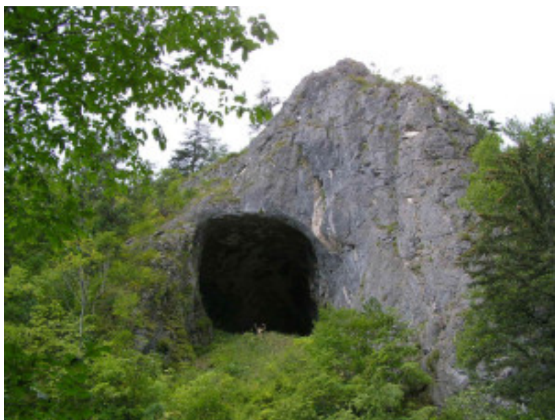
Пещера «Чертовы ворота» — место археологической стоянки на Дальнем Востоке.

Например, древняя ДНК из пещеры Чертовы ворота на Амуре – ей десять тысяч лет – сначала казалась ни на что не похожей. Но вот ее сравнили с ДНК ульчей – это крошечный народ на Амуре, и оказалось, что именно ульчи на протяжении тысячелетий сохранили древний генофонд, генетическую память древнейшего населения Дальнего Востока.