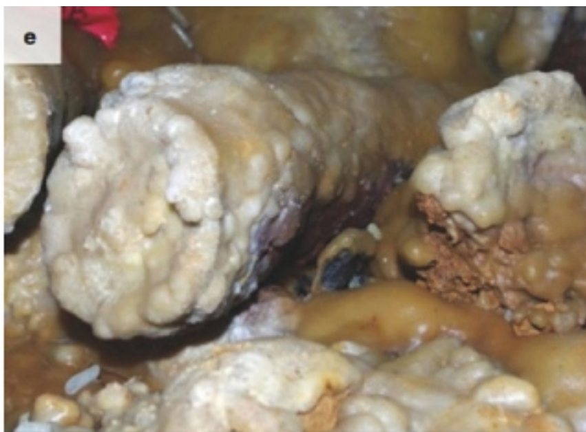
Известковые потеки на обломке сталагмита и обломке кости (фото É. Fabre, SSAC)

Следы огня на сталагмитах: покраснение и почернение (фото É. Fabre, SSAC)