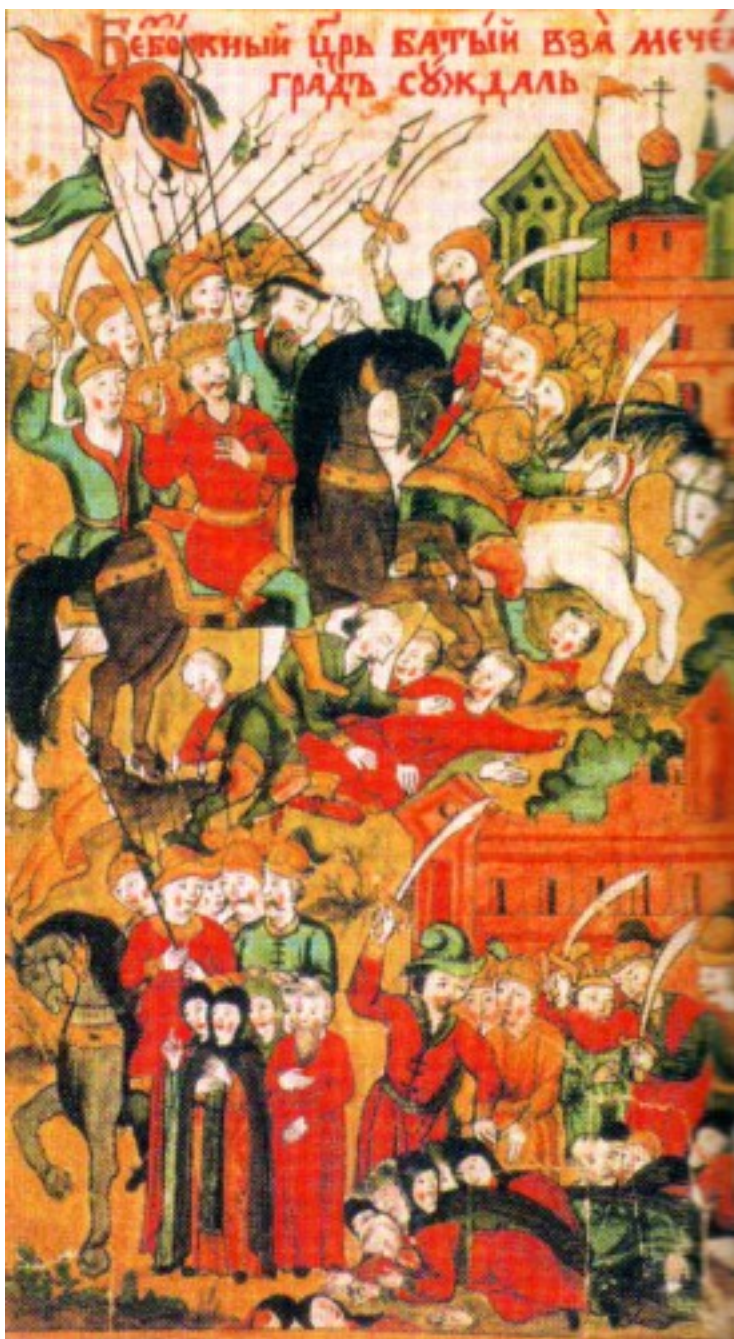
Взятие Батыем Суздаля. Миниатюра из Жития Ефросинии Суздальской

Более того, масштабное, а скорее – и вообще каменное строительство в Суздале явно не могло начаться ранее, чем Суздаль стал значимым политическим центром. И, согласно выводам С. В. Заграевского, «в Византии церковное строительство велось из плинфы или в смешанной технике – «opus mixtum»; из камня строили только на некоторых окраинах Византийской империи, и то лишь потому, что в горах и пустынях не было глины для обжига на плинфу. Плинфяной либо смешанной была и строительная техника Киева, Новгорода, Пскова, Полоцка, Смоленска, Чернигова, Переяславля Южного, Владимира Вольнского и всех остальных древнерусских земель, кроме Галицкой и Суздальской. В Галицком княжестве белокаменное строительство началось в 1110–1120-х годах, в Суздальском – в 1152 году ... » (Заграевский 2008: гл. 1).