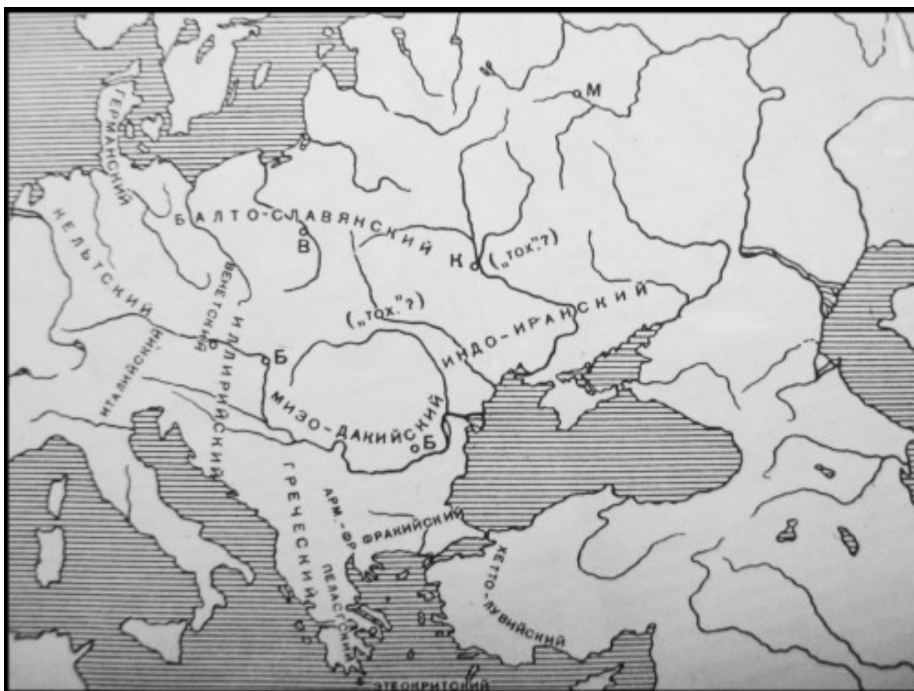
Вариант возможного расположения ранних индоевропейских языков в Европе около III тыс. до н.э. (по В.Георгиеву, 1958)

Картина диалектного членения индоевропейской области в её соотношении с исторически зафиксированным положением языковых групп для многих авторов служит убедительным подтверждением того, что даже если индоевропейцы были пришлыми в Европе, распад их языкового единства должен был начаться только после прихода сюда.