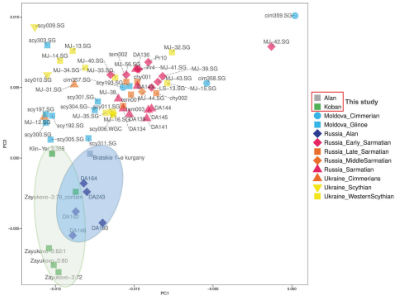
График анализа главных компонент. Носители кобанской культуры — зеленые квадраты, на фоне других археологических культур Северного Кавказа (Sharko et al., 2024).

Ранее опубликованные археологические и Y-хромосомные данные указывают на культурное и генетическое влияние скифов на кобанскую культуру. В данной работе проведенный анализ ADMIXTURE показал, что по профилю генетических компонентов носители кобанской культуры сходны с аланами и получили некоторый генетический поток от степных кочевников (для кобанской культуры это скифы, для аланов — сарматы). f-3 статистика также показала генетическое влияние степных кочевников и сходство с аланами, а f-4 статистика выявила генетический поток от носителей кобанской культуры к аланам. Анализ f-3 статистики, основанный на коллеляции частоты аллелей между древними и современными популяциями Кавказа и окружающих регионов, показал, что современные кумыки и лезгины больше, чем остальные этнические группы Кавказа, генетически связаны с носителями кобанской культуры. Авторы также предполагают общность ее генетических корней с изолированной этнической группой амшенских армян.