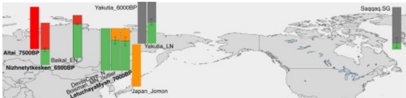
Распределение компонента ANA (зеленый цвет) в древних геномах; алтайский компонент показан красным цветом, якутский компонент — серым, японский компонент Дзёмон — оранжевым (Ke Wang et al., 2023).