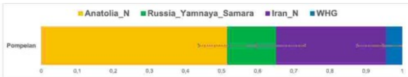
Моделирование генома из Помпей методом qpAdm из четырех источников: анатолийский неолит, степной компонент ямной культуры, иранский неолит и западные охотники-собиратели (WHG) (Scorrano et al., 2022).

Для более детального определения состава помпейский геном моделировали, используя метод qpAdm , как комбинацию четырех компонентов: анатолийский неолит, степной компонент ямной культуры, иранский неолит и западные охотники-собиратели (WHG).