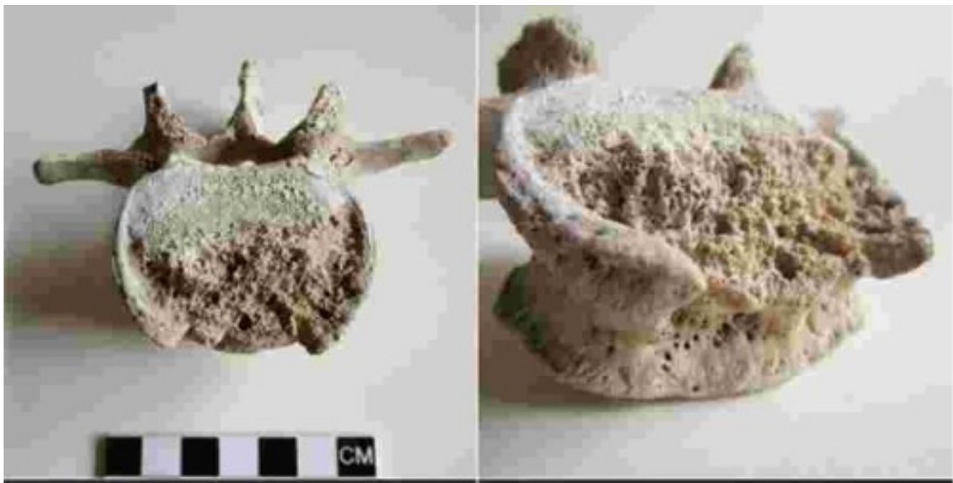
Костные позвонки мужчины из Помпей, пораженные костным туберкулезом (Scorrano et al., 2022).

Таким образом, впервые появилась возможность изучить геном жителя Помпей. Анализ показал, что он генетически близок к населению Средиземноморья, более всего – к населению Центральной Италии и Сардинии. Совокупность Y-хромосомных и аутосомных данных позволяет предположить, что предки этого человека появились на Итальянском полуострове из Анатолии, в неолите. Предположение, что этот человек страдал туберкулезом, согласуется с историческими данными о распространении этой болезни в Римской империи, чему способствовало увеличение плотности населения.