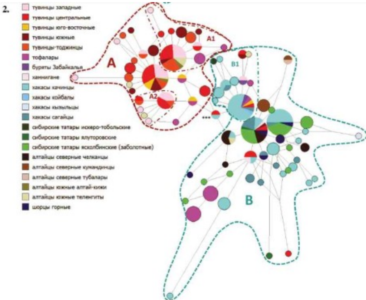
Рис. 2.2. Медианная сеть гаплогруппы N-L666 в популяциях Южной Сибири; в легенде обозначена принадлежность носителей гаплотипов к популяциям тувинцев и групп сравнения.

Согласно расчётам, возраст кластера А составляет в среднем около 600–700 лет, возраст кластера В — около 1500 лет. Достаточно близкими оказались датировки возникновения субкластеров А1, А2, В1: они составили в среднем 300–450 лет (500–700 лет – при использовании «генеалогической» скорости мутирования). Что касается времени возникновения самих кластеров А и В (их разделения от общего предка), то по STR-маркерам получена датировка 2,5 тыс. лет назад.