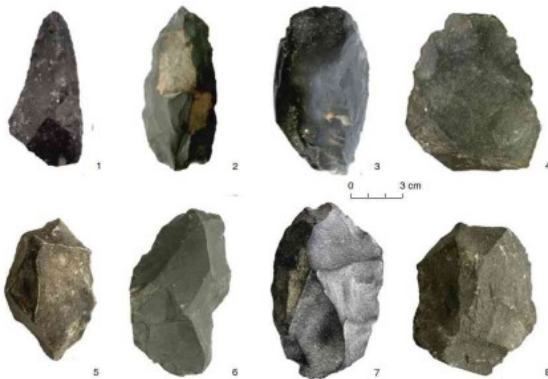
Каменные орудия начала среднего палеолита из слоев 14 и 15 Восточной галереи Денисовой пещеры (Brown et al., 2021).

Кто именно из проживавших в Денисовой пещере гоминин изготовил эти орудия – этот вопрос был предметом дискуссий археологов. Теперь же — поскольку они находились в том же слое, что и новые денисовские костные фрагменты, при отсутствии в этом слое останков других гоминин, можно достаточно уверенно считать, что это плод труда денисовцев. Таким образом, ученые впервые получили информацию о культуре и образе жизни денисовцев: они охотились на крупных животных, с помощью каменных орудий разделявали туши, использовали огонь, обрабатывали шкуры, а, возможно, и изготавливали одежду.