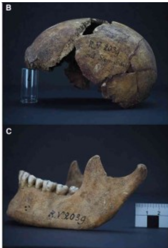
Череп и нижняя челюсть RV 2039 из коллекции Рудольфа Вирхова.

Палеогенетики под руководством специалистов из Кильского университета, Германия, исследовали ДНК всех четырех индивидов, включая анализ их бактериальных и вирусных патогенов. У RV 2039, датировка которого 5300 – 5050 лет назад, обнаружили ДНК Yersinia pestis .