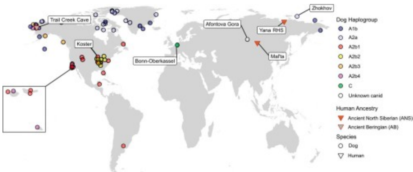
Рис. 1. Расположение местонахождений с изученными ДНК древних собак и людей в Евразии и Северной Америке (Perri et al., 2021).

Если сопоставить данные по ДНК древних собак и древних людей Сибири и Аляски, изученных в последние 10–15 лет, то наиболее вероятной выглядит связь появления собак с древними северными сибиряками (Ancient North Siberians, ANS), предки которых выявлены на Янской стоянке (около 32 тыс. лет назад) и стоянке Мальта (около 24 тыс. лет назад) (см. http://генофонд.рф/?page_id=31517 ) (рис. 1–2).