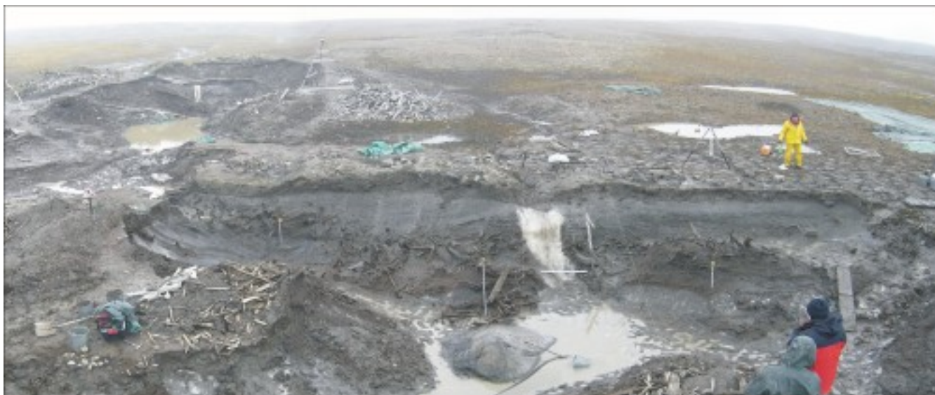
Рис. 2. Раскопки Жоховской стоянки (Pitulko et al., 2019; с изменениями).