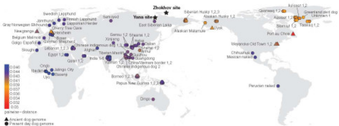
Рис.4. Географическое расположение изученных в работе древних и современных собак. Собака с о. Жохова и волк с Янской стоянки обозначены звездочками; другие древние образцы собак обозначены треугольниками; современные образцы собак – кружками. Генетические расстояния между древними и современными собаками и собакой с о. Жохова соответствуют цветам по шкале слева (Sinding et al., 2020).

На этот раз работы были сфокусированы на детальном анализе ДНК древней собаки и ее родственных связях с древними волками, а также с современными собаками Арктики и других регионов Земли. ДНК, извлеченную из нижней челюсти жоховской собаки, секвенировали с высоким качеством (покрытие 9,6х). Были также проанализированы ДНК волка с палеолитической Янской стоянки и 10 образцов ДНК современных гренландских ездовых собак. Вся полученная информация была сопоставлена с известными на сегодняшний день ДНК от 114 современных собак.