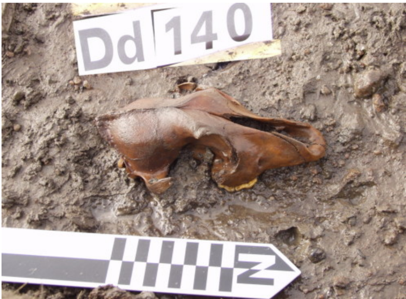
Рис. 3. Находка черепа собаки на Жоховской стоянке; фото В.В. Питулько.

На этот раз работы были сфокусированы на детальном анализе ДНК древней собаки и ее родственных связях с древними волками, а также с современными собаками Арктики и других регионов Земли. ДНК, извлеченную из нижней челюсти жоховской собаки, секвенировали с высоким качеством (покрытие 9,6х). Были также проанализированы ДНК волка с палеолитической Янской стоянки и 10 образцов ДНК современных гренландских ездовых собак. Вся полученная информация была сопоставлена с известными на сегодняшний день ДНК от 114 современных собак.