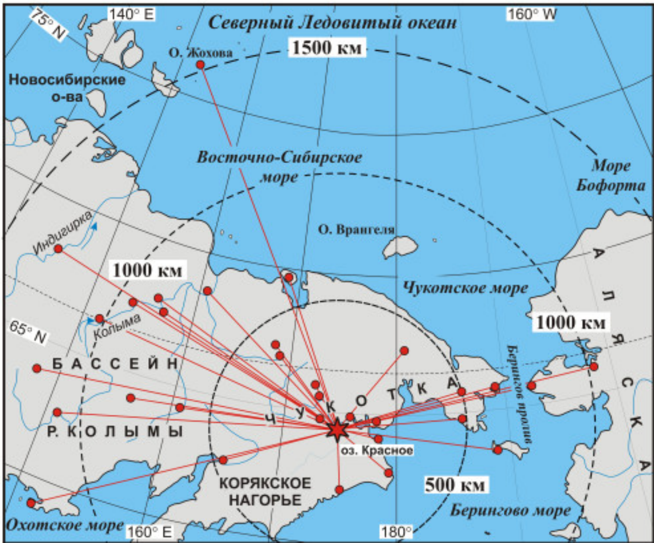
Рис. 5. Распространение обсидиана из источника на озере Красное по Сибири и Аляске (Grebennikov et al., 2018; Kuzmin et al., 2018, 2020; Pitulko et al., 2019).

Новое исследование о происхождении собак и их роли в жизни древнего человека является важнейшим вкладом в изучение истории появления и распространения по миру первого “компаньона” доисторических людей. В настоящий момент собака с о. Жохова является самым ранним представителем домашних животных в северной Евразии, и одним из древнейших – во всем мире.