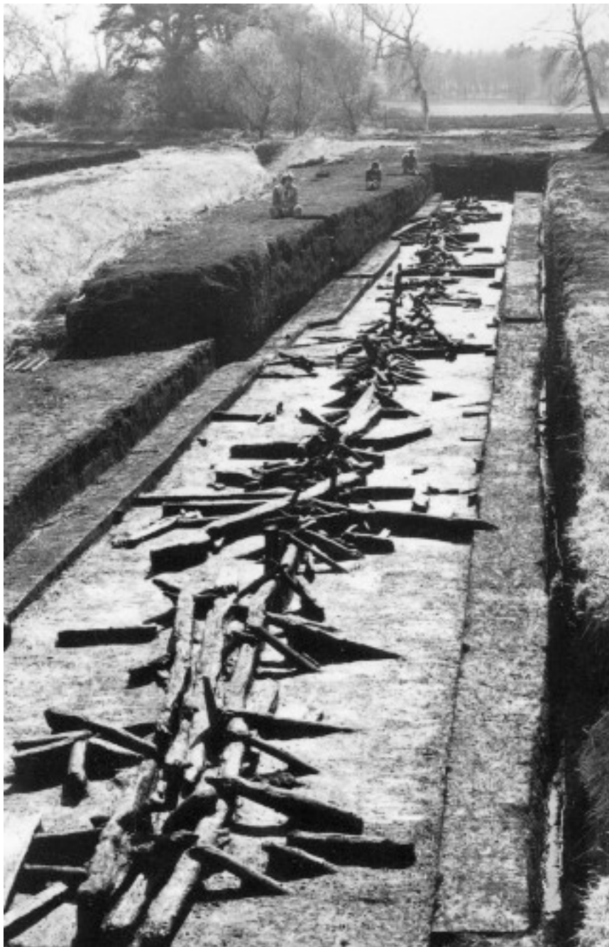
Рис. 2. Общий вид настила Свит Трак (Coles, Coles, 1989. P. 157)

км (рис. 2). Многие бревна сделаны из дуба, для которого на Британских островах существует длинная дендрохронологическая шкала, имеющая точность, равную одному календарному году (см. Кузьмин, 2017. С. 221–229). На основании изучения древесных колец из Свит Трака установлено, что мостовая была построена в 3807–3806 гг. до н.э. и функционировала в течение нескольких десятилетий, а затем была перекрыта формирующимся на болоте торфом. Радиоуглеродное ( ^{14}\text{C} ) датирование липидов из керамики Свит Трака показало возраст 5110 \pm 25 и 5092 \pm 26 ^{14}\text{C} лет назад, что соответствует календарному (т.е. астрономическому; см. Кузьмин, 2017. С. 160–166) возрасту около 3950–3800 гг. до н.э. (рис. 3), и находится в полном соответствии с независимыми дендрохронологическими данными.