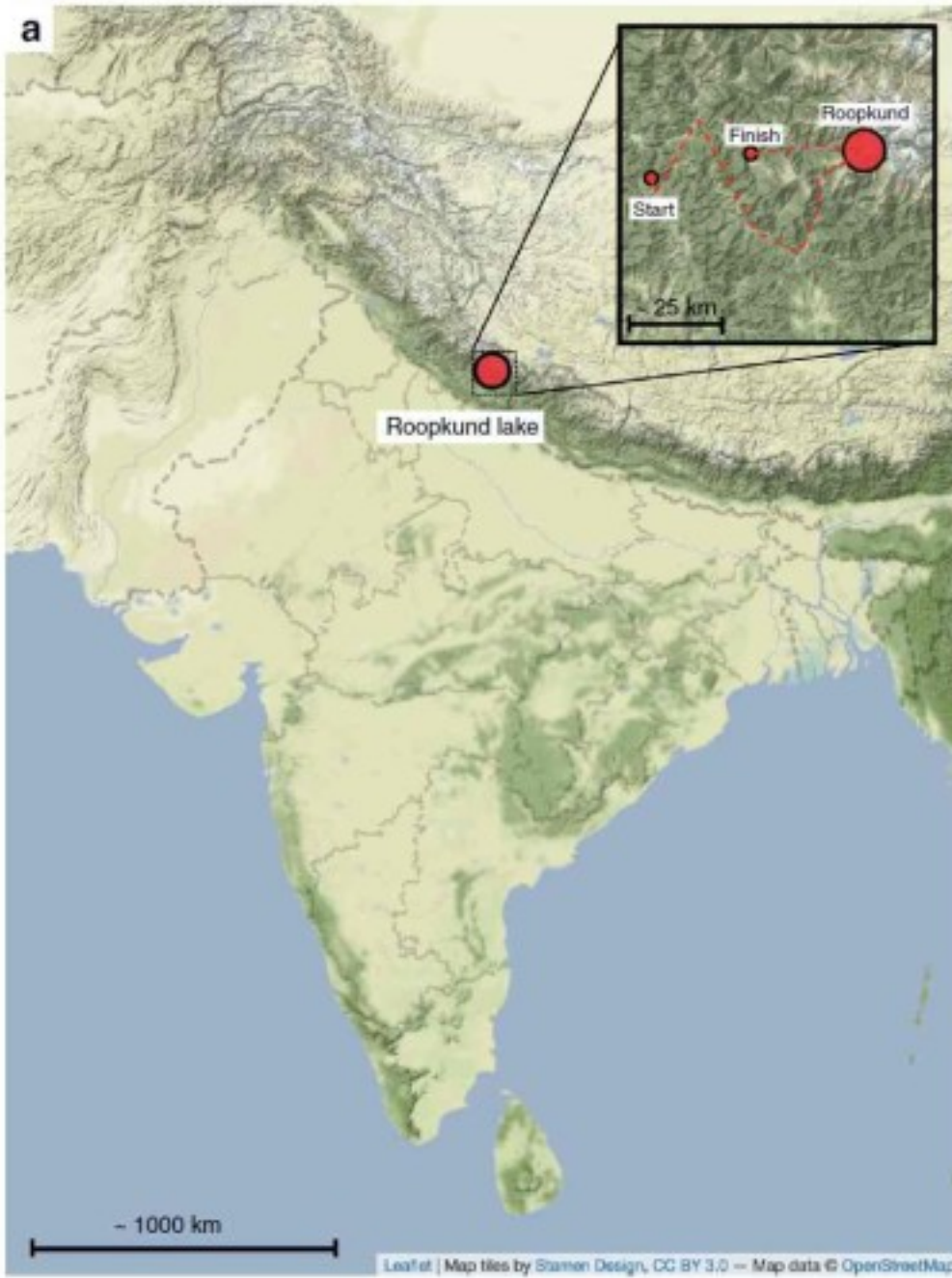
Местоположение озера Рупкунд.