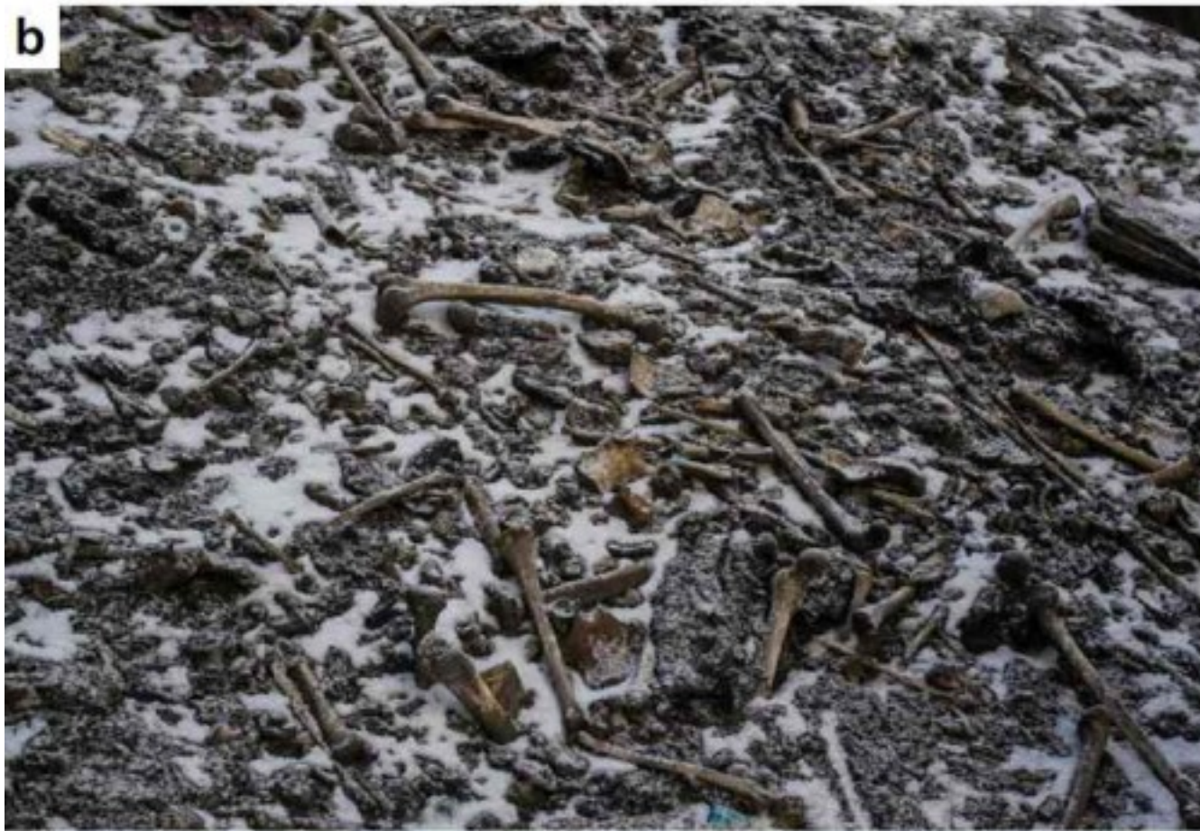
Скопление костей на берегах озера.

Чтобы разобраться в загадке Озера скелетов, ученые провели серию биоархеологических анализов: исследования древней ДНК, исследование диеты изотопными методами, радиоуглеродное датирование, антропологическое изучение костей и остеологические анализы.