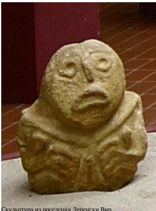
Скульптура из поселения Лепенски Вир

В истории заселения Европы один из наиболее остро обсуждаемых вопросов – это взаимоотношение ранних земледельцев, несущих навыки культивирования растений и одомашнивания животных с Ближнего Востока, с местными племенами охотников-собирателей. В разных работах ответ на этот вопрос дается по-разному. Например, в статье испанских генетиков журнале Scientific Reports , исследуя митохондриальную ДНК разных периодов из разных регионов Европы, авторы делают вывод, что ближневосточные земледельцы почти полностью замещали охотников-собирателей, а генетическое смешение между ними было минимальным. Авторы статьи в Nature на основе изучения ядерной ДНК приходят к противоположному выводу—о мирном сосуществовании земледельцев с европейскими охотниками-собирателями и о постоянно происходящем генетическом смешении. К тому же выводу приходят и авторы статьи о неолите в Балканском регионе : об интенсивном генетическом смешении и культурном обмене местных охотников-собирателей и мигрировавших земледельцев.