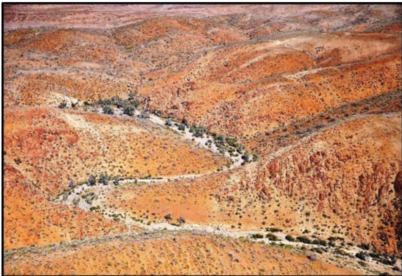
Ландшафт в Варратии.